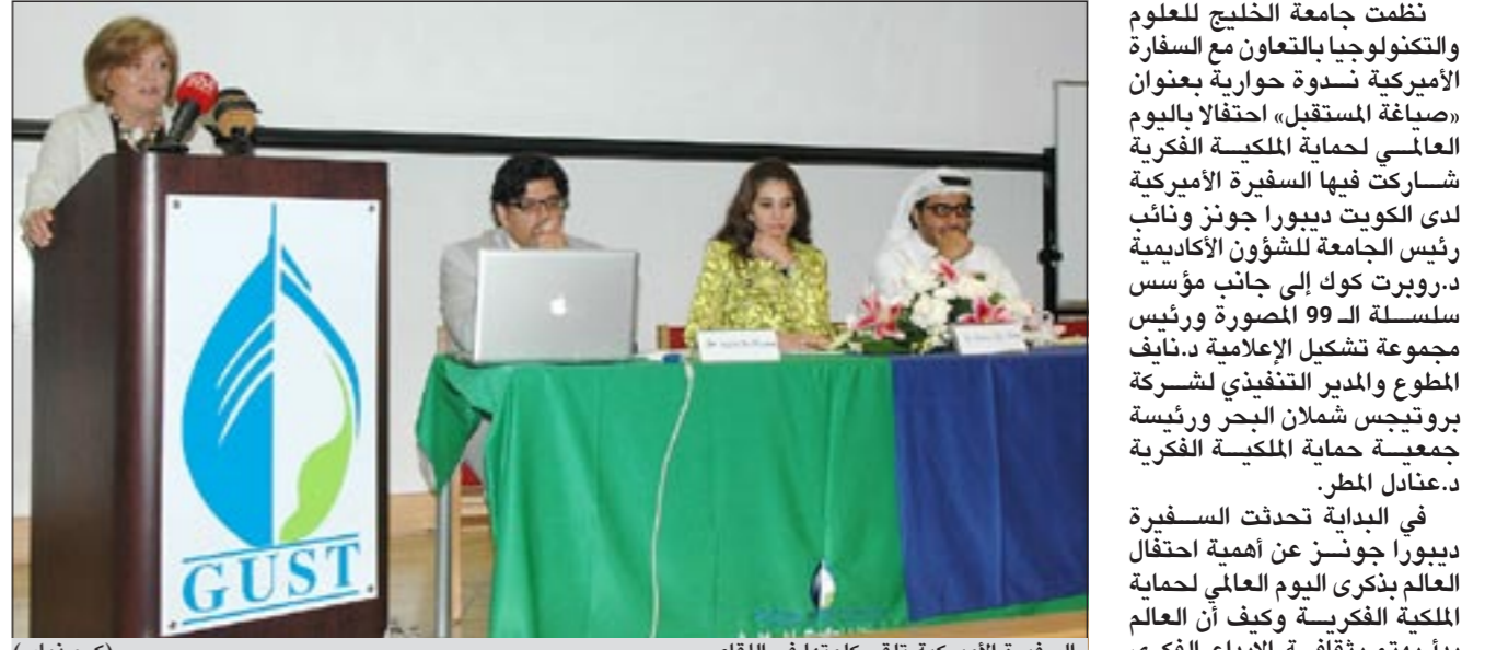
السفيرة الأميركية تلقي كلمتها في اللقاء