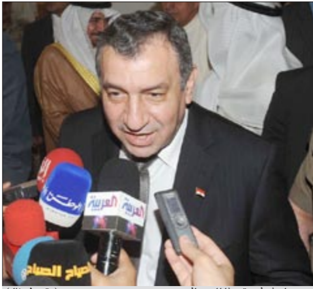
د. عصام شرف متحدثاً للصحافيين