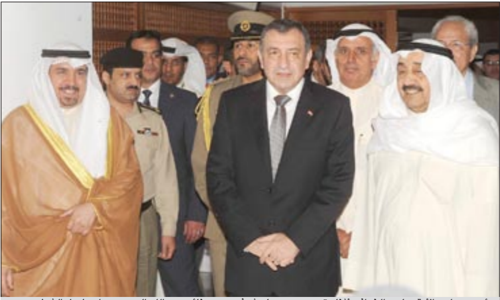
رئيس مجلس الأمة جاسم الخرافي أثناء توديعه د. عصام شرف ويبدو نائبه عبدالله الرومي ود. اسماعيل الشطي