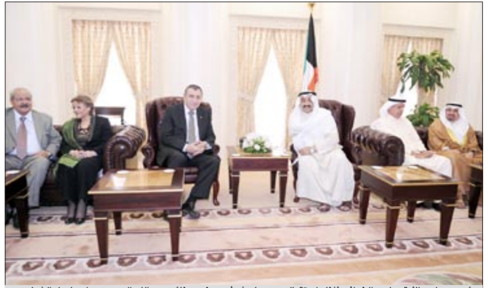
رئيس مجلس الأمة جاسم الخرافي أثناء استقباله د. عصام شرف بحضور نائبه عبدالله الرومي ود. اسماعيل الشطي

الوزير المصري مع عدد من المستثمرين الإماراتيين لمناقشة الزيارة المرتقبة والإعداد لها بما يعمل على نجاحها. واعرب عن استغرابه لما اثير في شأن توتر العلاقات بين البلدين الشقيقين مصر والإمارات وأن ذلك لا يتعدى «الشائعات»، مبيناً موقف مصر من إيران ينبع من كونها دولة من دول العالم «ونحاول فتح صفحة جديدة معها».