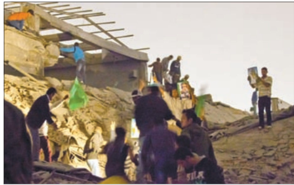
مناصرو القذافي يتفقدون مكتب العقيد في باب العزيزية بعد تعرضه للقصف مساء أمس الأول

طرابلس- وكالات: أدى قصف جوي لحلف شمال الأطلسي ليل أمس الأول الذي تدمير مكتب الزعيم الليبي معمر القذافي بالكامل داخل مقر إقامته في باب العزيزية بينما سمع دوي انفجارات قوية في أحياء عدة من العاصمة التي حلت طائرات في أجوائها، كما قال مراسلو وكالة فرانس برس.