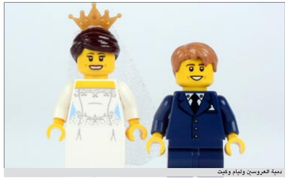
دمية العروسين وليام وكيت

وجاء في نشرة للجماعة المدافعة عن حقوق الحيوان أن نحو 1500 دودة قرّ تقتل لإنتاج 100 غرام فقط من الحرير الطبيعي المستخدم في تصنيع الملابس التقليدية في الهند وهي أكبر مستهلك له في العالم. وثاني أكبر منتج له بعد الصين. ويتم زفاف وليام وكيت يوم الجمعة القادم في حفل يتوقع خبراء ان يشاهده مليوناً نسمة في العالم.