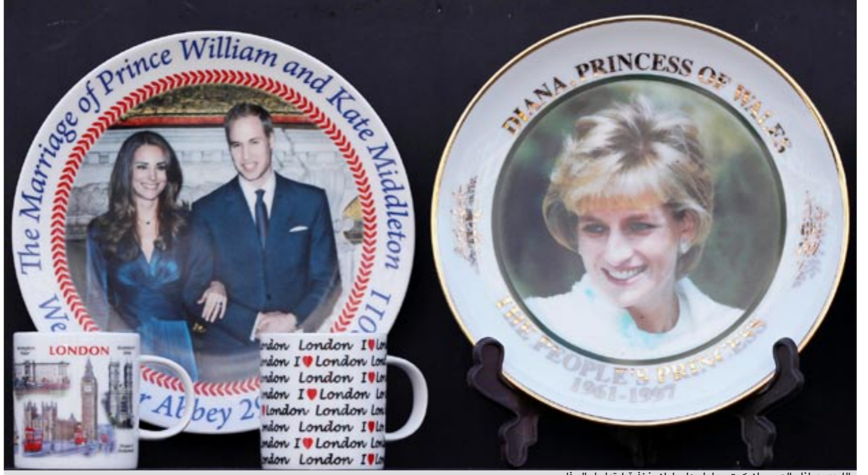
الليدي ديانا والعروسان كيت ووليام على اوان خزفية ابتهاجا بالحلل

باريس: تناقلت مواقع التواصل الاجتماعي عبر الإنترنت أن السيدة الفرنسية الأولى، كارلا بروني، حامل في شهرها الرابع بينت، وستطلق عليها اسم «ساندرا». وبحسب مجلة «كلوسر» فإن كارلا بروني (43 عاما) حملت بعد ثلاث سنوات من الزواج، وأضافت المجلة أن رغبة النجمة الإيطالية في أن تنجب من الرئيس الفرنسي قد تحققت. في حين كشفت المجلة بالمقابل عن مصدر مقرب من السيدة الأولى في فرنسا: «لا نعرف ما إذا كان الجنين ذكرا أم أنثى، مازال الوقت مبكرا على ذلك، لكن المؤكد أن السيدة الفرنسية الأولى حامل». ونقلت المجلة نفسها أن بداية حكاية تحقيق رغبة السيدة الأولى في أن تنجب ثالثة تحققت خلال الرحلة، التي قام بها الرئيس الفرنسي