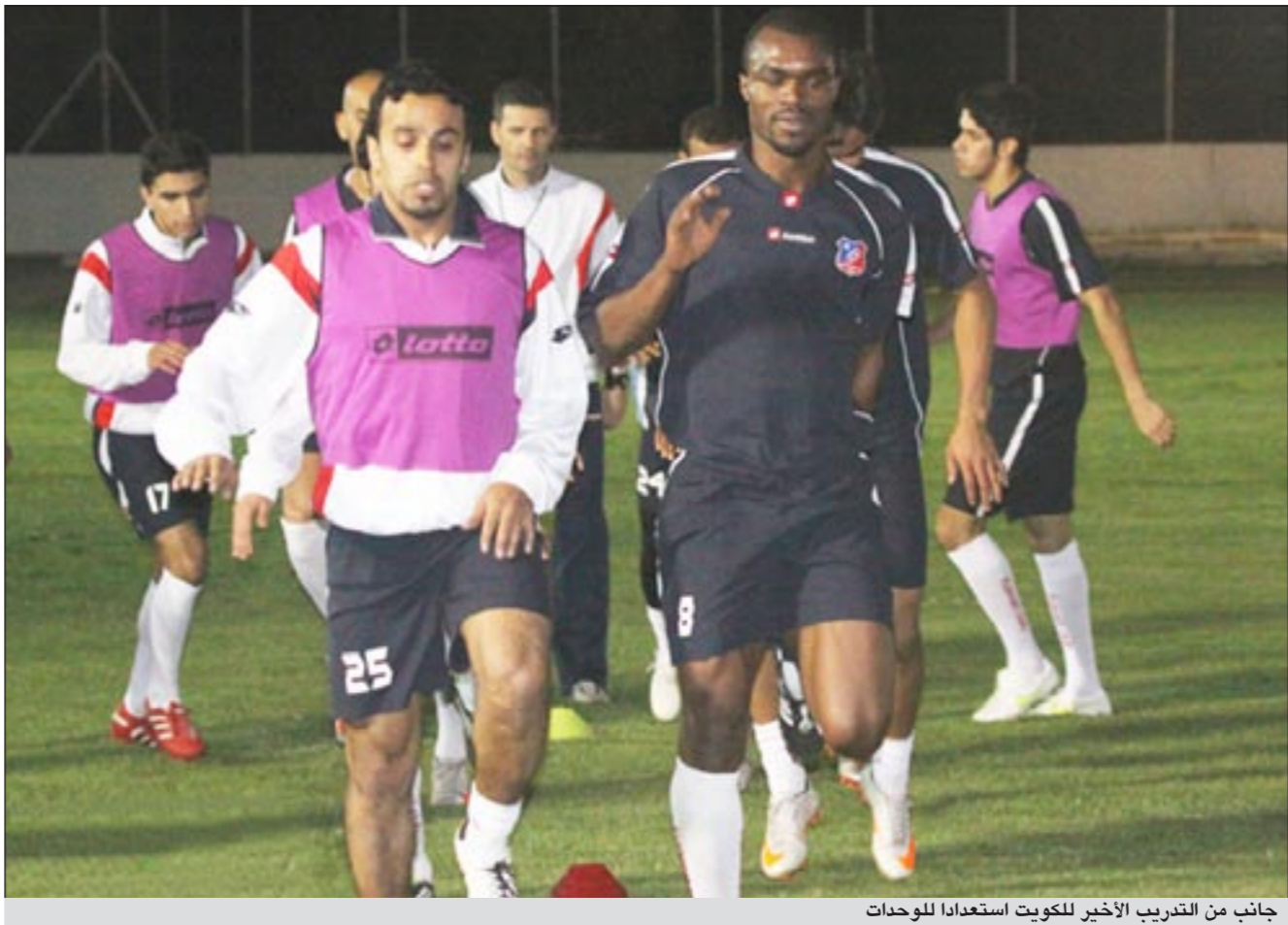
جانب من التدريب الأخير للكويت استعدادا للوحدات

وتم اختيار فريق وزارة الدفاع الفريق المثالي