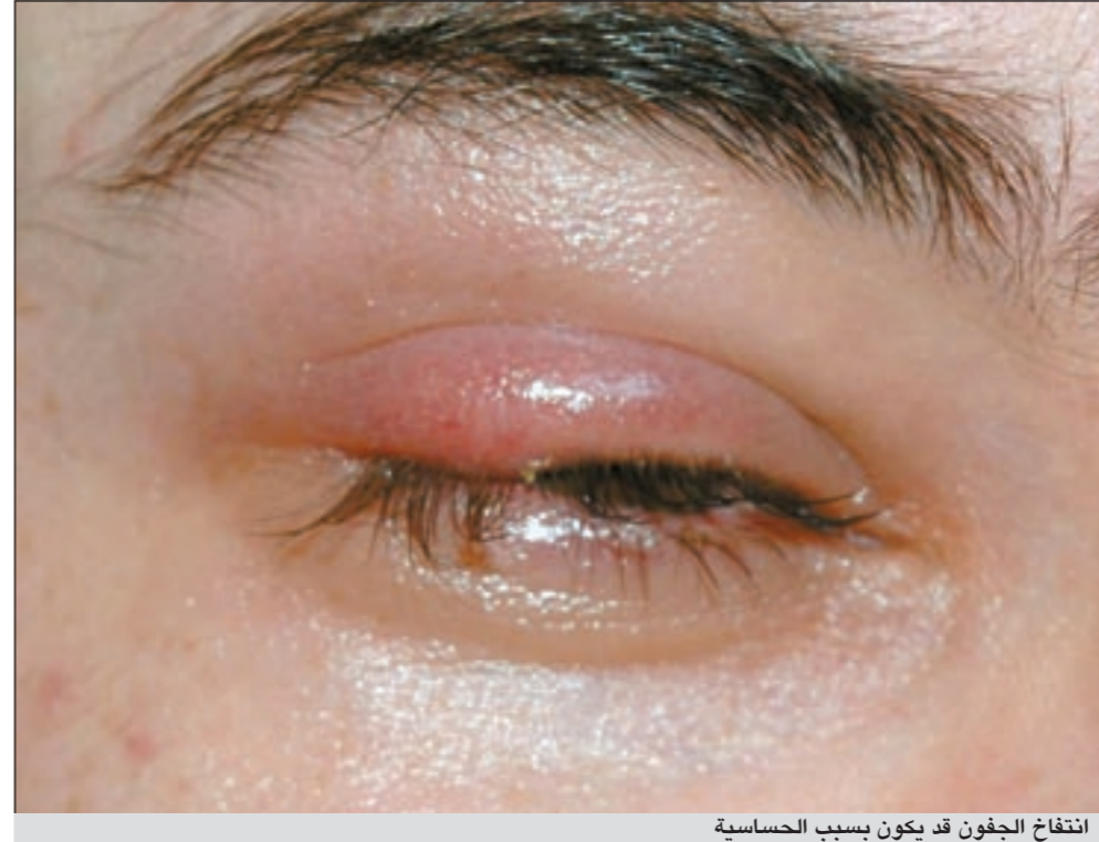
انتفاخ الجفون قد يكون بسبب الحساسية

أما الجديد فهو عملية الليزر التي تتم عن طريق توجيه الليزر الى السطح الداخلي للقرنية، عن طريق فتحة فيها فيسمح للمريض برؤية واضحة في نفس يوم العملية، ولا يوجد أي ألم تقريبا بعد العملية، وكانت هذه الفتحة قبل ذلك تتم عن طريق مشرط كهربائي ولكن أحدث تقنية هي عمل هذه الفتحة عن طريق الليزر