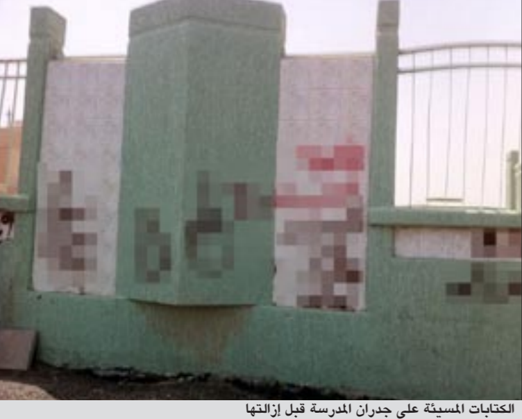
الكتابات المسيئة على جدران المدرسة قبل إزالتها