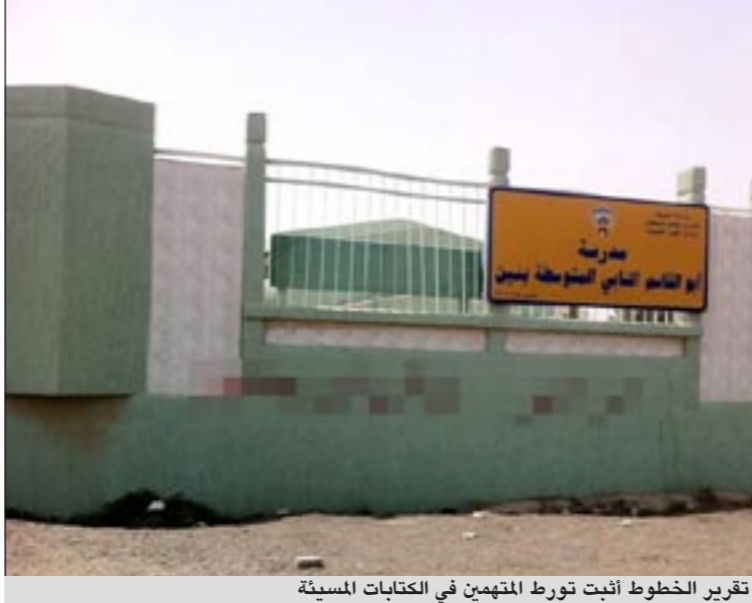
تقرير الخطوط أثبت تورط المتهمين في الكتابات المسيئة