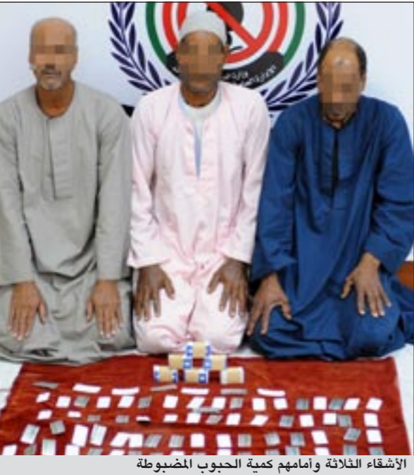
الأشقاء الثلاثة وأمامهم كمية الحبوب المضبوطة

من اقنصاع الوافد العاطل عن العمل ببيعهم 800 حبة مقابل 400 دينار وبعد تسلمه المبلغ المرفق القي القبض عليه ليرشد عن شقيقه والذي ارشد رجال المباحث عن 1500 حبة قام بدفنها في ساحة ترابية مقابلة لمسكنهم كما اكسدا حيازة كمية اخرى بحوزة شقيقهم الثالث وجميعهم عاطلون عن العمل حيث اعترفوا بانهم