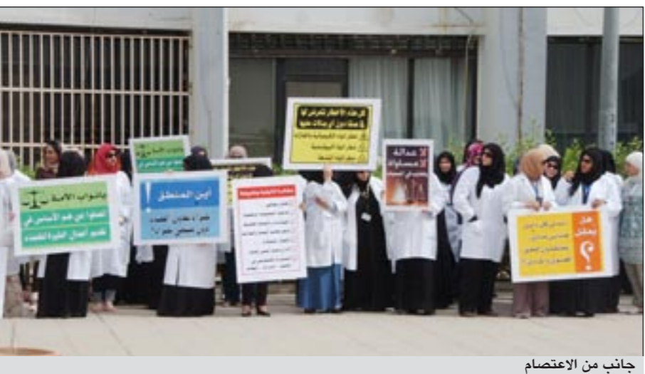
جانب من الاعتصام

نظم عدد من الموظفين المدنيين في الإدارة العامة للأدلة الجنائية صباح امس اعتصاما للمطالبة بإقرار كادر لتوحيد المسميات الوظيفية وتوفير الضمانات والحماية القانونية وتوفير معايير الصحة والسلامة وأقرار الأعمال الممتازة وادراج وظائفهم تحت مسمى المهن الشاقة والمساواة بالعسكريين في المناصب والدورات والبعثات حيث استمر الاعتصام لمدة نصف ساعة امام امام مبنى الإدارة العامة وسط تواجد امني، ورفع المعتصمون لافتات تطالب بتحقيق العدالة والمساواة، وقرار الكادر كونهم حملة الشهادات العليا والمتخصصة والفنية.