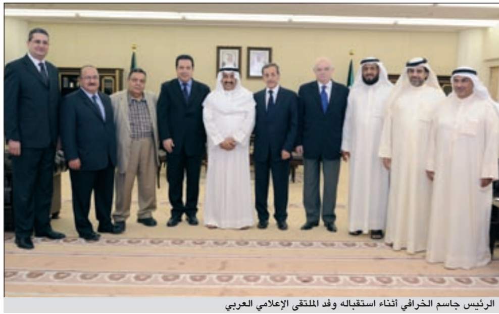
الرئيس جاسم الخرافي أثناء استقباله وفد الملتقى الإعلامي العربي

زاهي وهي والكاتب الصحفي عبد الوهاب بدرخان ومدير تحرير جريدة «النهار» اللبنانية غسان حجار ورئيس تحرير جريدة «اللواء» اللبنانية صلاح وسلام والصحافي أنور الياسين ووزير الإعلام في الحكومة الانتقالية الليبية محمود الشام.