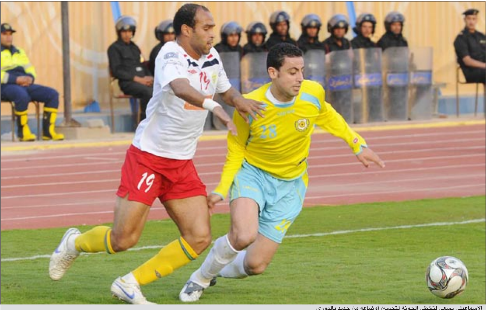
الإسماعيلي يسعى لتخطي الجونة لتحسين أوضاعه من جديد بالدوري