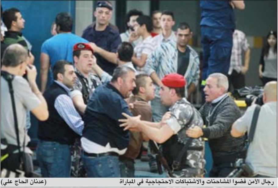
رجال الأمن قضاوا المشاحنات والإشتباكات الاحتجاجية في المباراة