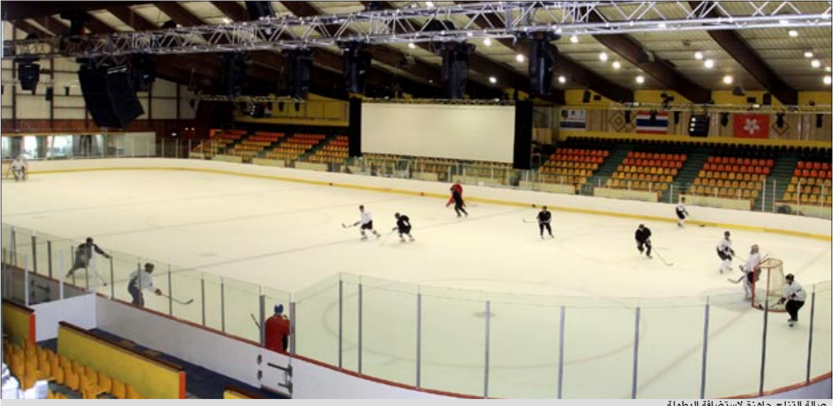
صالة التزلج جاهزة لاستضافة البطولة