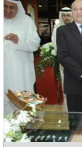
.. ويستمع لشرح عن معروضات إحدى الشركات