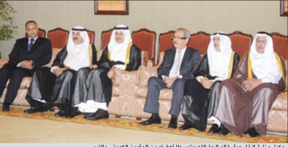
وكيل وزارة الخارجية خالد الجارالله متوسطا أعضاء من الوفدين الكويتي والليبي

خلالها في هذا الاتجاه. روابط تاريخية مع الشعب الكويتي من جهته أكد رئيس المجلس الانتقالي الليبي مصطفى عبدالجليل ان ليبيا تربطها بالشعب الكويتي وروابط تاريخية عربية تمتد من اصول تاريخية، مشيدا بقرار دول مجلس التعاون الخليجي الذي كان اول من اصدر قرارا بدعم المجلس الانتقالي ناهيك عن القرارات الاخرى من الدول العربية والدولية بالحظر الجوي