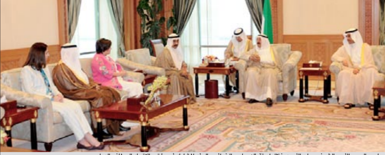
صاحب السمو الأمير الشيخ صباح الأحمد خلال استقباله جاسم الخرافي والوفد المشارك في مؤتمر الاتحاد البرلماني الدولي