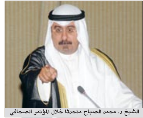
الشيخ د. محمد الصباح متحدثا خلال المؤتمر الصحافي