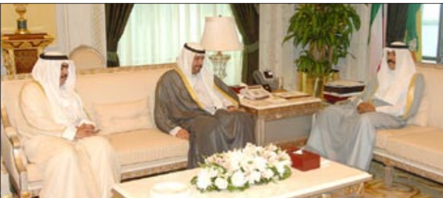
سمو ولي العهد الشيخ نواف الأحمد مستقبلا الشيخ أحمد الفهد وروضان الروضان

استقبل سمو ولي العهد الشيخ نواف الأحمد في ديوانه بقصر السيف أمس رئيس مجلس الأمة جاسم الخرافي. كما استقبل سمو ولي العهد الشيخ نواف الأحمد بقصر السيف أمس رئيس مجلس الأمة جاسم الخرافي. كما استقبل سمو ولي العهد الشيخ نواف الأحمد بقصر السيف أمس رئيس مجلس الأمة جاسم الخرافي. كما استقبل سمو ولي العهد الشيخ نواف الأحمد بقصر السيف أمس رئيس مجلس الأمة جاسم الخرافي.