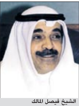
الشيخ فيصل المالك

أكد وكيل وزارة الإعلام الشيخ فيصل المالك حرص الوزارة على الثوابت الوطنية وإذكاء روح المواطنة الصالحة بين المواطنين بجميع فئاتهم واندماجهم. جاء ذلك خلال اجتماعه مع وكيل الوزارة المساعد لشؤون الإذاعة محمد العواش وقريب عمل الإذاعة بمناسبة استعدادات قطاع الإذاعة للاحتفال بمرور 60 عاما على إنشاء إذاعة الكويت. وقال المالك ان الوزارة تتفخر بالدور الرائد الذي لعبته إذاعة الكويت طوال تلك العقود الـ 6 من إنشائها، كما اننا نفتخر بالرواد الذين اكبوا عمل تلك الإذاعة وما زالت بصماتهم واضحة حتى ذلك التاريخ، ولا ننسى في الوقت نفسه جهود بانثنا والعاملين في قطاع الإذاعة ونحني جهودهم النيرة في تطوير العمل الإذاعي. وبشأن احتفال الإذاعة ذكر المالك أنه اعطى تعليماته بأن تبتث فعاليات تلك الاحتفالية