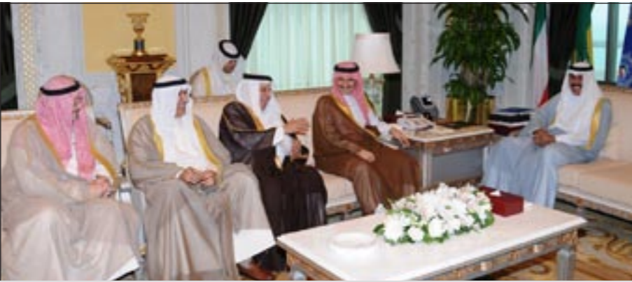
سمو ولي العهد خلال لقائه الأمير الوليد بن طلال والوفد المرافق له

استقبل سمو ولي العهد الشيخ نواف الأحمد في ديوانه بقصر السيف أمس رئيس مجلس الأمة جاسم الخرافي. كما استقبل سمو ولي العهد الشيخ نواف الأحمد بقصر السيف أمس رئيس مجلس الأمة جاسم الخرافي. كما استقبل سمو ولي العهد الشيخ نواف الأحمد بقصر السيف أمس رئيس مجلس الأمة جاسم الخرافي. كما استقبل سمو ولي العهد الشيخ نواف الأحمد بقصر السيف أمس رئيس مجلس الأمة جاسم الخرافي.