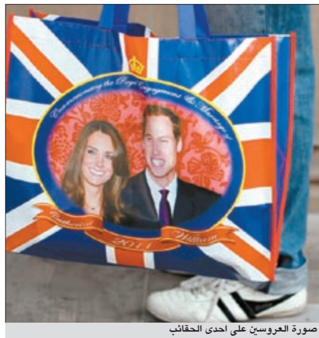
صورة العروسين على إحدى الحقائق

الإناث وفقا للقانون الأساسي الصادر في عام 1701 وبالتالي نجد أن الأميرة (آنا) الابنة الثانية للملكة بريطانيا الحالية (إليزابيث الثانية) تحتل المركز العاشر الملكي.