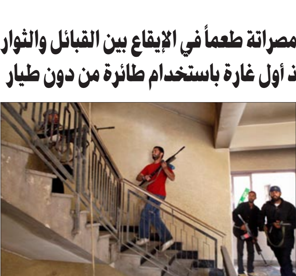
نوار لبيبون يفتشون أحد الأبنية في موقع مقدم من مدينة مصراتة