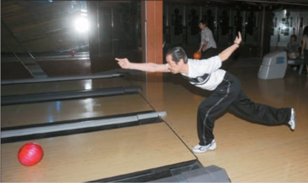
السفير الياباني يشارك في لعبة البولينغ (متين غوزال)