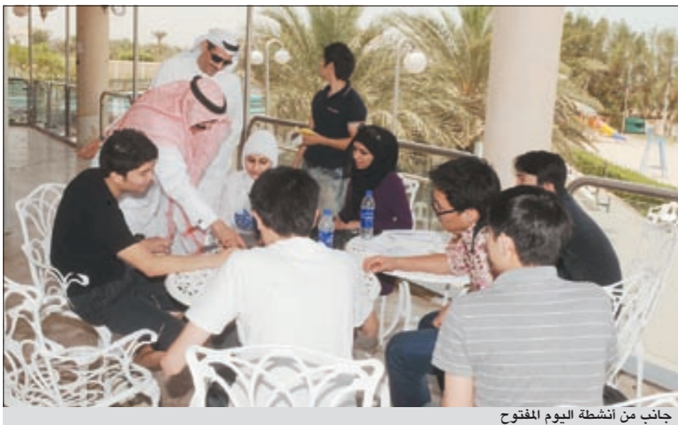
جانب من أنشطة اليوم المفتوح

ما يولد انسجاما بين دول العالم في توثيق علاقات الصداقة البناءة.