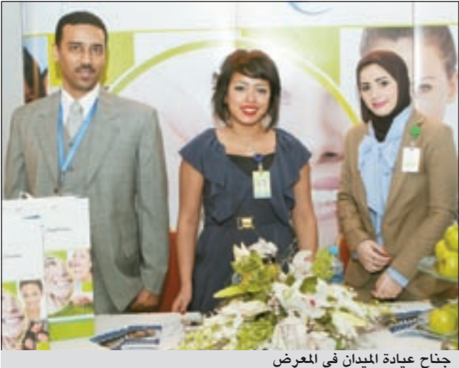
جناح عيادة الميدان في المعرض

بعيادة اسنان متكاملة من الداخل وقادرة على تقديم العلاج والاستشارات للمراجعين في الموقع الذي تزوره، كما أنه في الاسابيع المقبلة سيكون هناك جدول زمني لهذه الزيارات وسيعلن عنه لاحقا ليتسنى للجميع ان يحضر ويستفيد من هذه الخدمة غير المسبوقة في الكويت.