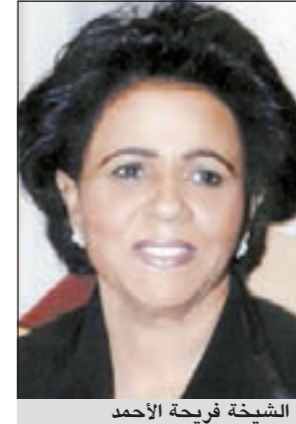
الشيخة فريحة الأحمد

فاق التوقع وتجاوز بنسبة كبيرة معدل الإقبال على دورة 2010، وأشارت اللجنة إلى أن عشرات من كبريات الشركات الكويتية والعربية والعالمية تشارك بفاعلية في «كنوز»، وتتقدمها شركات الأربش الحديثة للمجوهرات، والأربش للمجوهرات، ومجوهرات الخضير، ومجوهرات الهند، وشركة فنون واحجار كريمة، وشركة أنطوان حكيم & روميليس وريموس، وشركة مجوهرات الشعار، وشركة فلوس للمجوهرات، وشركة حمد عبدالله الفارس وأولاده للمجوهرات، وشركة مجوهرات مادونا فيري، وشركة ماريي للمجوهرات، وشركة مارينا جالاكسي للتجارة - دبي، وشركة أوكتيوم وشركة شوكت شمالي للمجوهرات، وشركة ترافالجار، وشركة فيفيان داباس للمجوهرات.