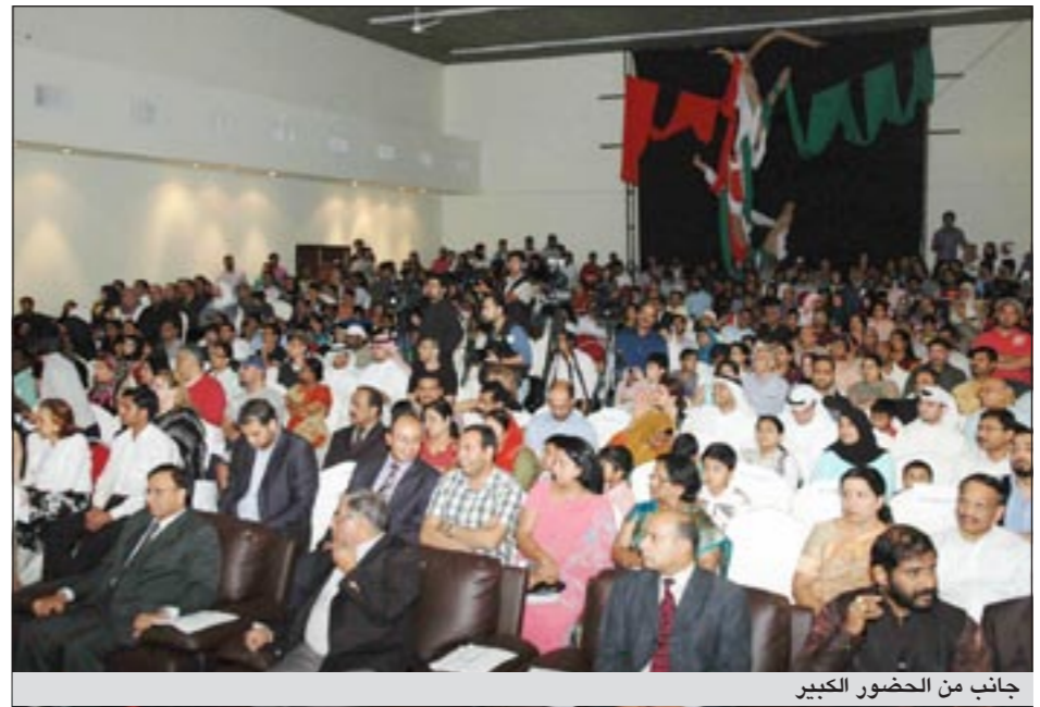
جانبا من الحضور الكبير

وسط حضور دبلوماسي وفني وإعلامي كبير اختتم مساء أمس الأول في المعهد العالي للفنون الموسيقية المنتدى السيمفوني الدولي الأول الذي أقيم طوال الأسبوع الماضي برعاية نائب رئيس الوزراء وزير الخارجية الشيخ محمد الصباح، متضمنا عدة أنشطة موسيقية قدمها طلاب المعهد والدول الصديقة.