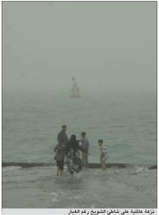
نزهة عائلية على شاطئ الشويخ رغم الغبار