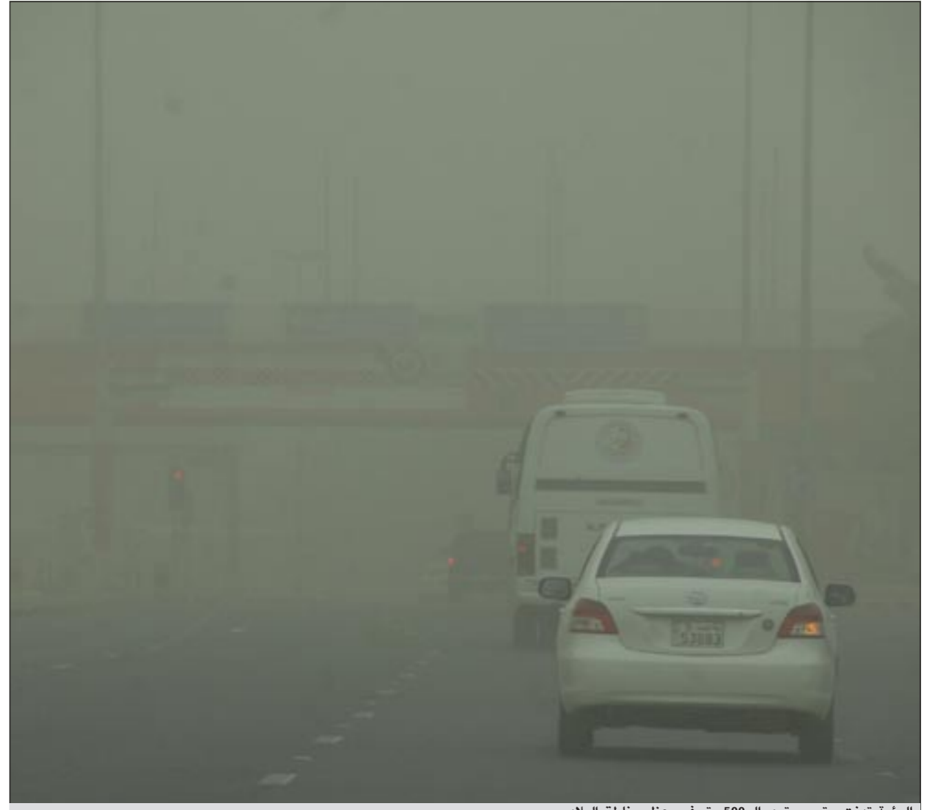
الرؤية تدنت حتى مستوى الـ 500 متر في معظم مناطق البلاد