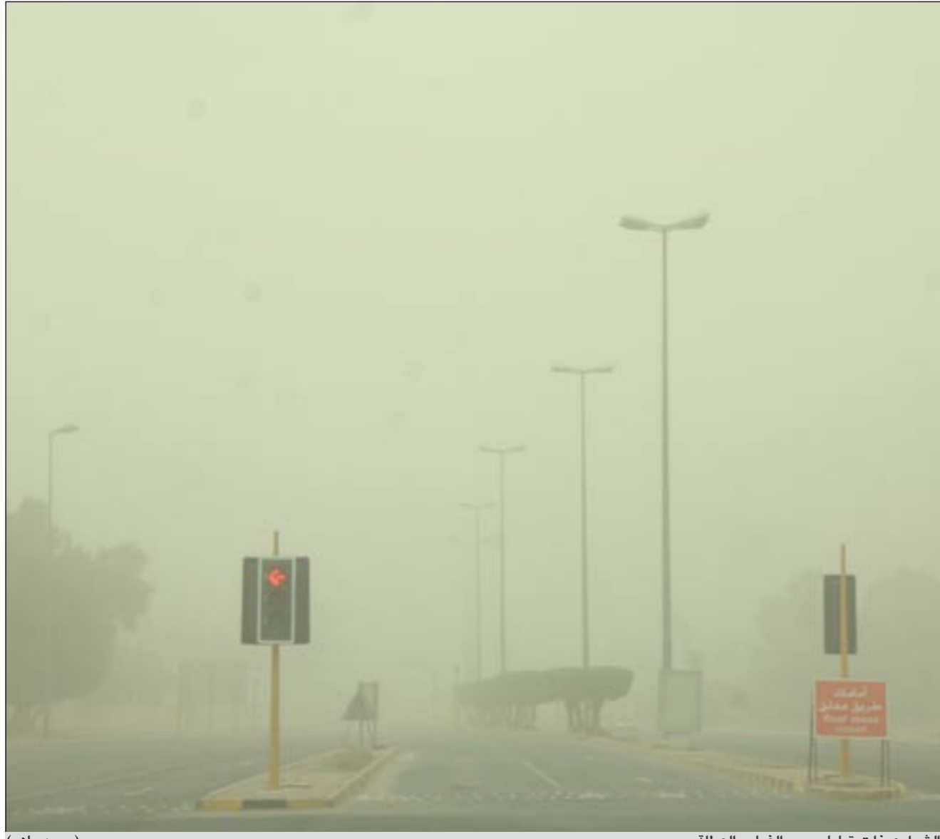
الشوارع خلت تماما بسبب الغبار والعطلة (محمد ماهر)