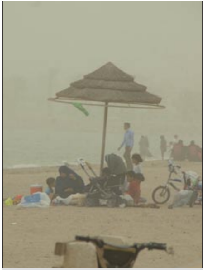
الغبار لم يمنع العائلات من الاستمتاع بالاجازة