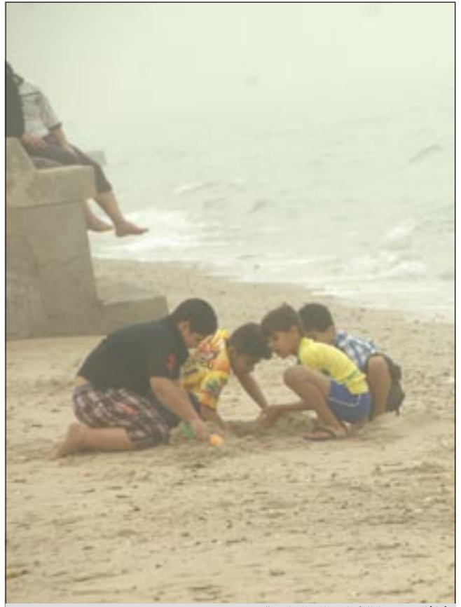
اطفال تحذوا الغبار على الواجبة