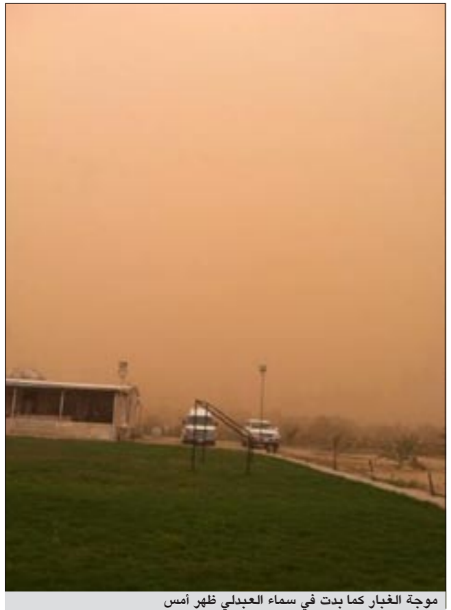
موجة الغبار كما بدت في سماء العبدلي ظهر أمس

توقع العالم الفلكي د. صالح العجيري ان موجة الغبار التي تسيطر على الأجواء حاليا ستستمر حتى بعد غد الإثنين، موضعا ان البلاد تتعرض لمنخفضات جوية تسببت في اضطراب من طبقات الجو ما أدى الى تزايد سرعة الرياح وبالتالي إثارة الغبار. وأشار الى اننا لا نزال في فترة السريبات وستتخللها موجات غبار وامطار متفرقة وعواصف رعدية قد تنشأ خلال الايام المقبلة، وفيما اطلقت إدارة الارصاد الجوية أمس تحذيرا عن امكانية هبوب عاصفة رعدية تعم البلاد، نفى مصدر مسؤول بالإدارة العامة للطيران المدني تأثر حركة الطائرات أمس، وذلك على خلفية السريبات التي