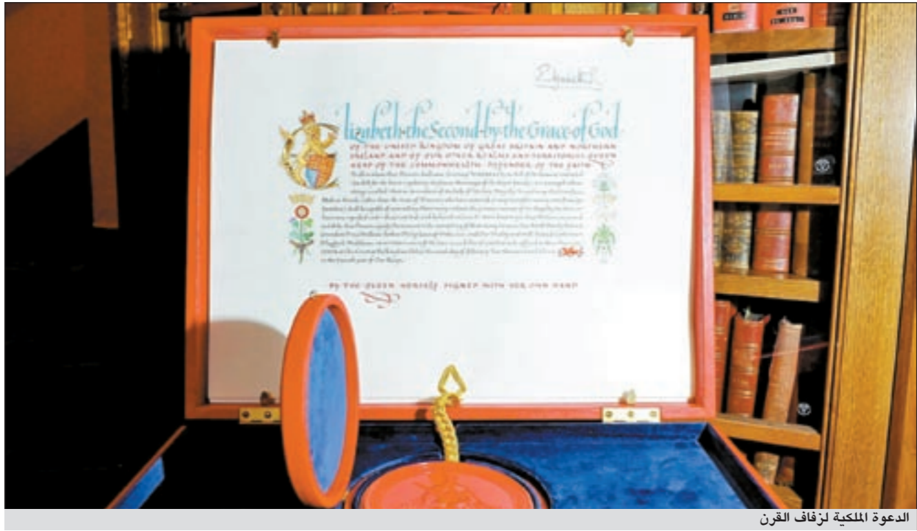
الدعوة الملكية لزفاف القرن

تتجمع «ويستمينستر آبي» بكنائس «الكنيسة الخاصة»