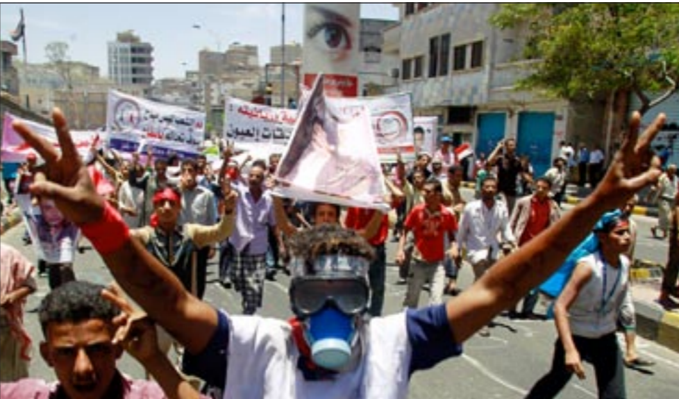
متظاهرون يمنيون في تعز يطالبون برحيل الرئيس

وفي سياق الوساطة الخليجية المستمرة، وصل الى صنعاء أمس أمين عام مجلس التعاون الخليجي عبد اللطيف الزياتي في زيارة قصيرة للقاء الرئيس اليمني