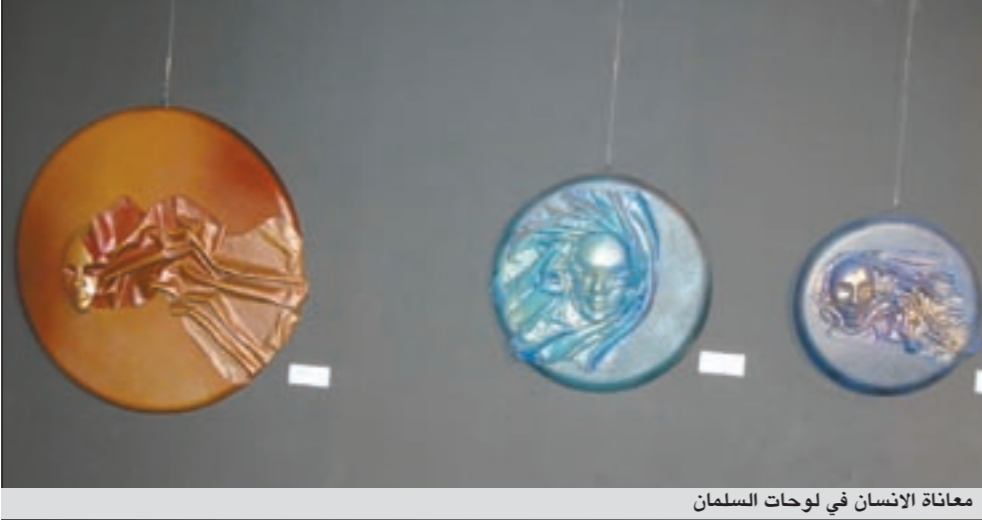
معاناة الإنسان في لوحات السلطان