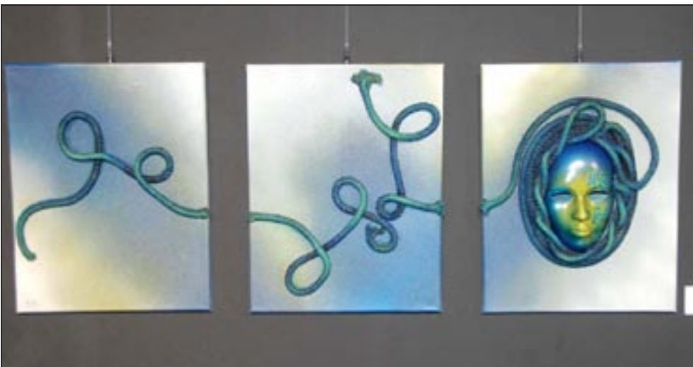
اقتعه معبرة للفنانة مريم السلطان