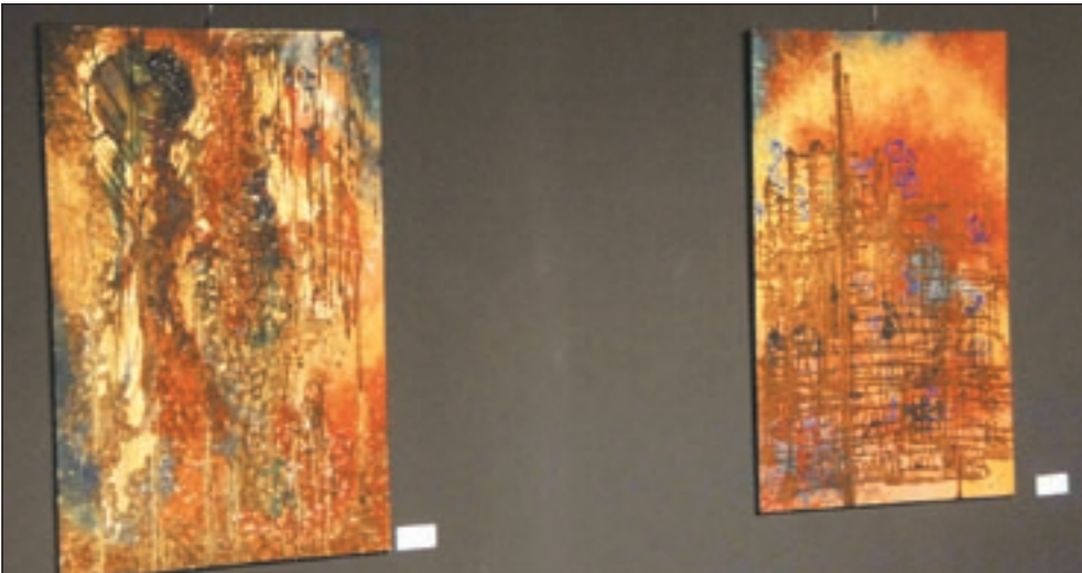
بعض اللوحات المميزة للقريني