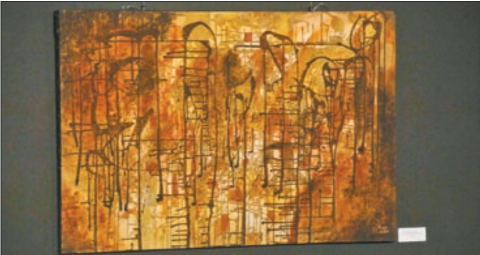
خطوط القهوة التركية علي لوحات القريني