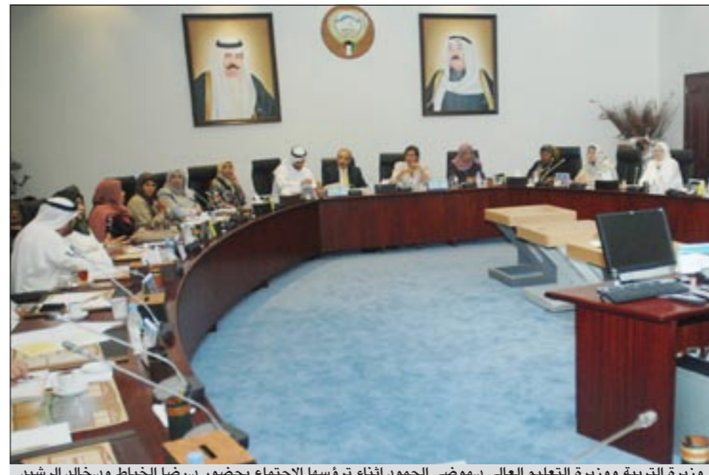
وزيرة التربية ووزيرة التعليم العالي د.موضي الحمود أثناء ترؤسها الاجتماع بحضور د.رضا الخياط ود.خالد الرشيد

ومن ناحية أخرى دشنت وزيرة التربية ووزيرة التعليم العالي د.موضي الحمود المرحلة الأولى لمشروع أطلس على شبكة الانترنت كمرحلة تجريبية لنظام الأطلس التعليمي الرقمي للمرافق والخدمات التعليمية المعتمد على نظام المعلومات