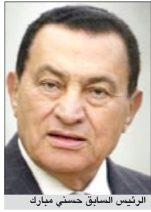
الرئيس السابق حسني مبارك