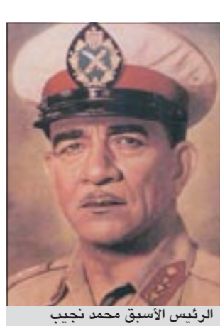
الرئيس الأسبق محمد نجيب