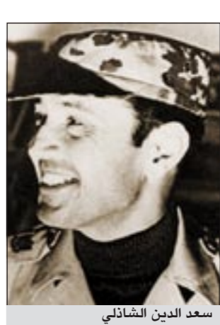
سعد الدين الشاذلي

ديبي - العربية.نت: أصدرت اللجنة المشكلة من جانب وزارة التربية والتعليم لتنقيح كتابي التاريخ للصفين السادس الابتدائي والثالث الإعدادي السادس الابتدائي الفريق سعد الدين الشاذلي، رئيس أركان حرب القوات المسلحة أثناء حرب أكتوبر 1973، واللواء أركان حرب محمد نجيب، أول رئيس لجمهورية مصر، إلى مناهج التاريخ بداية من العام الدراسي المقبل 2011/2012. كما قررت رفع صور سوزان مبارك والجزئية الخاصة بالحزب الوطني المنحل» بقرار المحكمة الإدارية من المناهج. وقد سلمت اللجنة المشكلة من 3 مؤرخين وأستاذ مناهج برئاسة