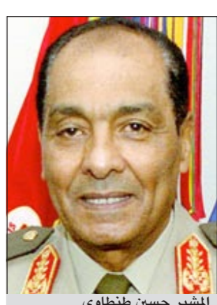
اللواء عمر سليمان

باغماءة مفاجئة في المطار، وترك منصبه هو الآخر بعدها بأسابيع. وقيل لمبارك بيان التنحي أو التخلي عن الحكم تلقونيا بعد أن استقر في شرم الشيخ من دون أي مناقشة ويطلب تعديل مجرد كلمة واحدة من كلماته التي بلغ عددها 31 كلمة، واستغرق الإقاؤها من عمر سليمان أقل من دقيقة واحدة «50 ثانية». وطلب مبارك تأجيل الإعلان عن هذا القرار بعض الوقت حتى يطمن على ولديه علاء وجمال اللذين كانا يستعدان للإقلاع في طائرة ثانية. وأصبحت زوجة الرئيس السابق مبارك سوزان ثابت