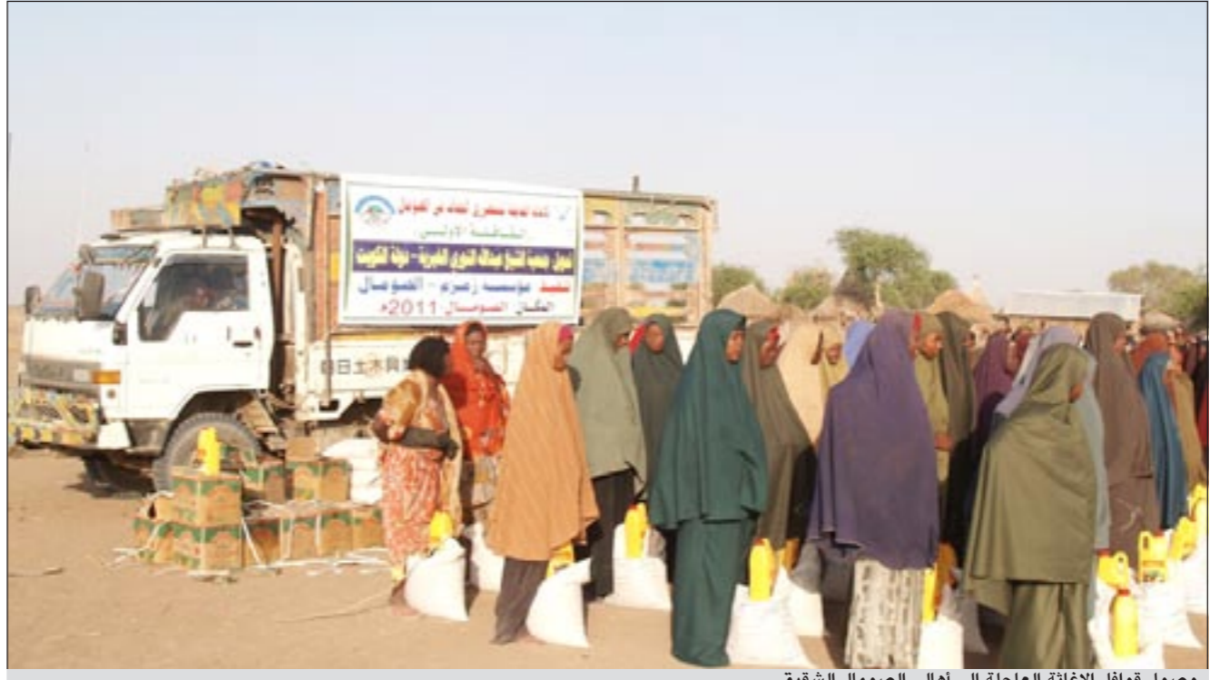
وصول قوافل الإغاثة العاجلة إلى أهالي الصومال الشقيق