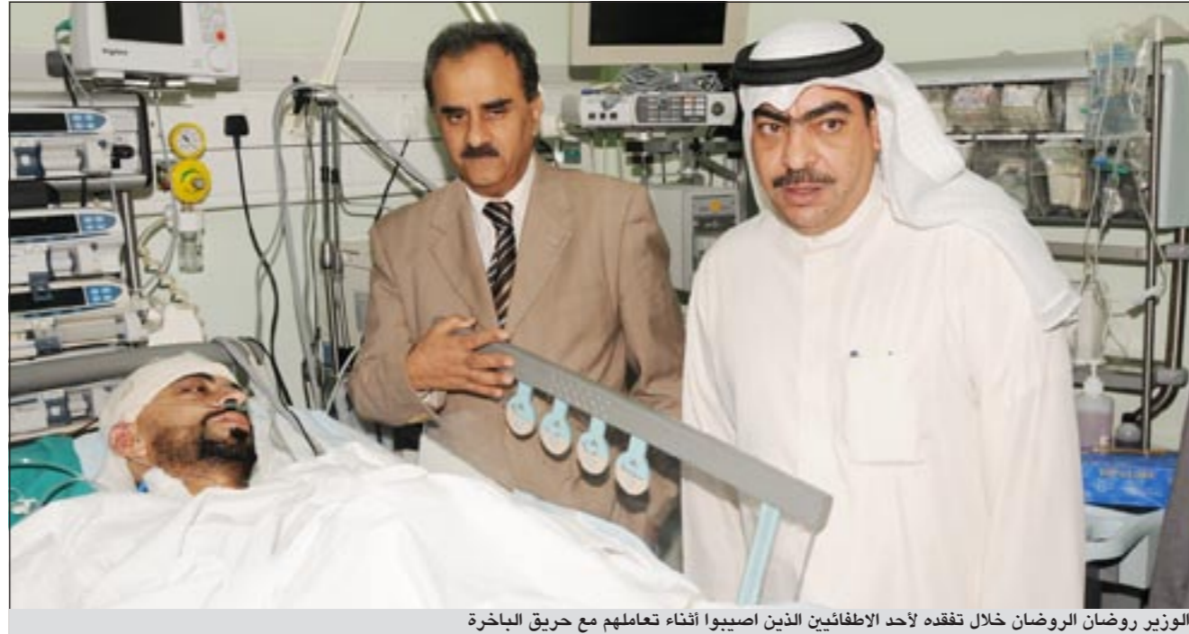
الوزير روضان الروضان خلال تفقده لأحد الاطفيانين الذين اصابوا أثناء تعاملهم مع حريق الباخرة