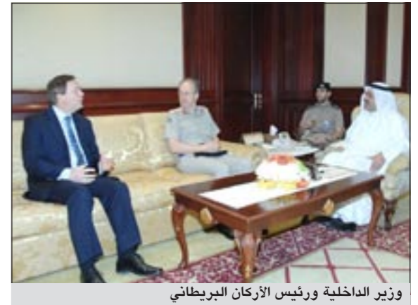
وزير الداخلية ورئيس الأركان البريطاني

أكد نائب رئيس مجلس الوزراء ووزير الداخلية الشيخ أحمد الحمود أهمية تعزيز التعاون العسكري والأمني مع بريطانيا لمواجهة المستجدات على الساحتين الإقليمية والدولية التي تستدعي الحذر والحيلة.