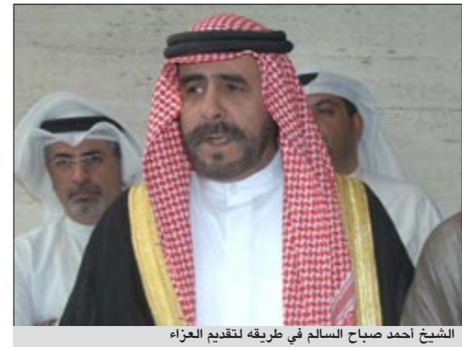
الشيخ أحمد صباح السالم في طريقه لتقديم العزاء