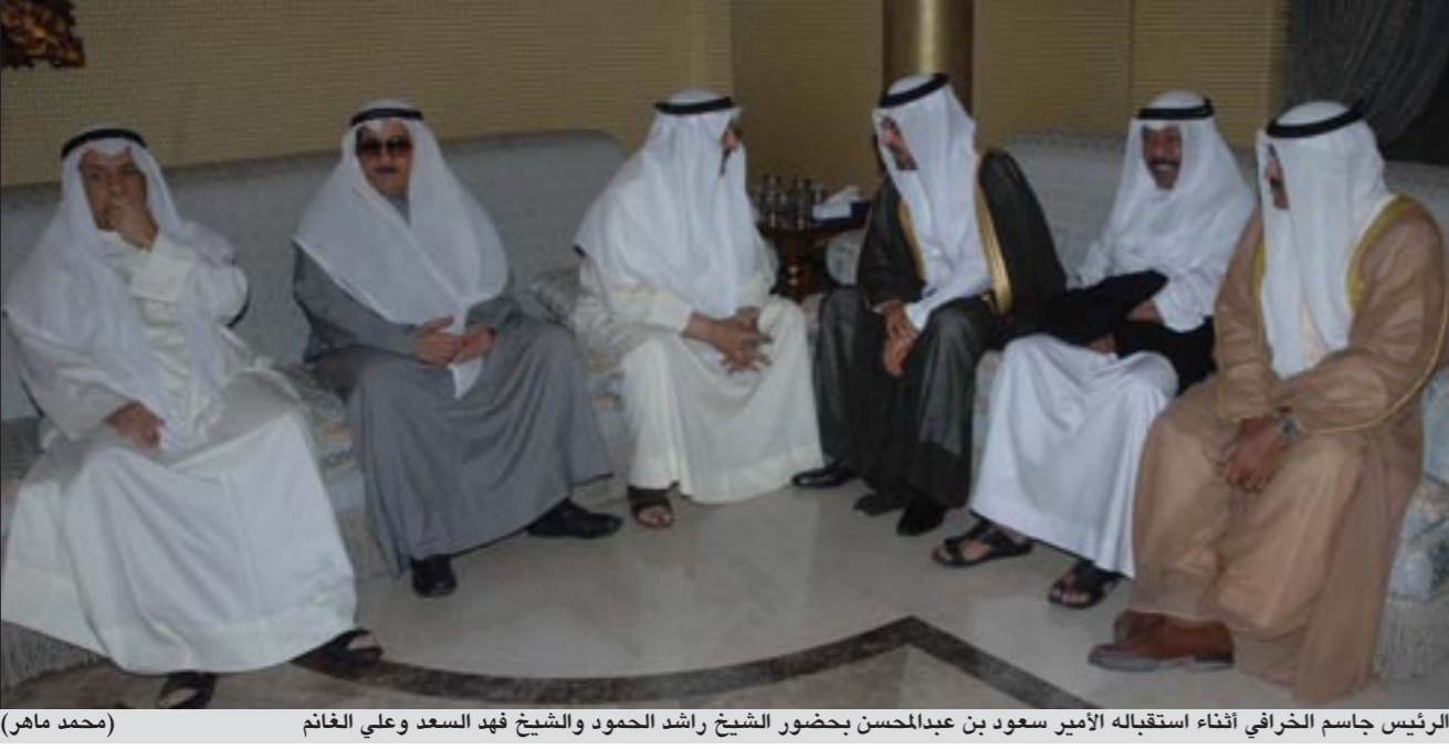
الرئيس جاسم الخرافي أثناء استقباله الأمير سعود بن عبدالمحسن بحضور الشيخ راشد الحمود والشيخ فهد السعد وعلي الغانم (محمد ماهر)