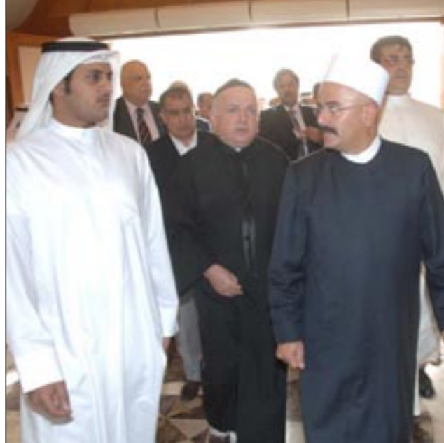
بعض رجال الدين يقدمون واجب العزاء