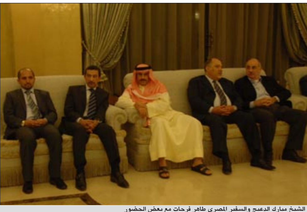
الشيخ مبارك الدعيج والسفير المصري طاهر فرحات مع بعض الحضور