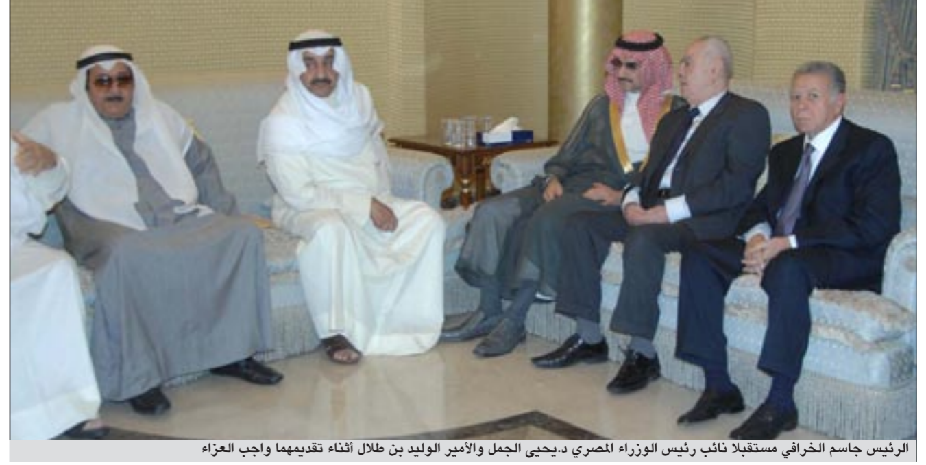
الرئيس جاسم الخرافي مستقبلاً نائب رئيس الوزراء المصري د. يحيى الجمل والأمير الوليد بن طلال أثناء تقديمهما واجب العزاء