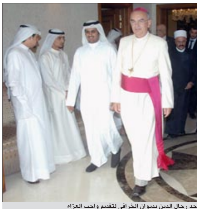
أحد رجال الدين بديوان الخرافي لتقديم واجب العزاء