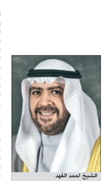
الشيخ احمد الفهد

وأضاف الملا ان أولويات المخصص لهم على المخطط جاءت في منطقة شمال غرب الصليبخات حتى تاريخ 31 ديسمبر 1993 وفي منطقة القيروان حتى 31 يناير 1994