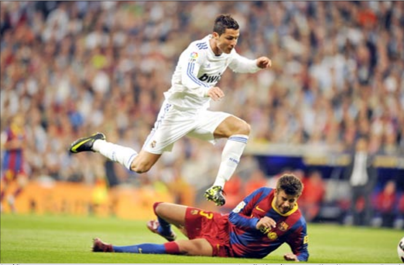
تجم ريال مدريد كريستيانو رونالدو يمر من مدافع برشلونة جيرارد بيكيه