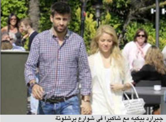
جيرارد بيكيه مع شاكيرا في شوارع برشلونة

ذكرت وسائل الإعلام الإسبانية أن علاقة لاعب كرة القدم الإسباني الدولي جيرارد بيكيه بالمطربة الكولومبية الشهيرة شاكيرا لم يعد بها أي مجال للشك، ونشرت وسائل الإعلام الإسبانية أمس عددا من الصور ومقاطع الفيديو لبيكيه وشاكيرا وهما يتبادلان القبلات ويتشابكان الأيدي عقب تناولهما وجبة الغداء في برشلونة، وأوضحت وسائل الإعلام الإسبانية أمس أن بيكيه (24 عاما) نجم برشلونة الإسباني وشاكيرا (34 عاما) تناولتا الغداء معا يوم الجمعة الماضي قبل يوم واحد من لقاء القمة «الكلاسيكو» والذي انتهى بالتعادل، وانتشرت أنباء العلاقة بين النجمين البارزين في الأسابيع الماضية، علما أنهما تعرفا على بعضهما البعض قبل بطولة كأس العالم 2010 بجنوب أفريقيا، حيث شارك بيكيه في تصوير الفيديو الخاص بأغنية «واكا واكا» التي أنتدتها شاكيرا في افتتاح البطولة، وذكرت صحيفة «إل بايس» الإسبانية في موقعها على الإنترنت أن شاكيرا وبيكيه يعترضان بناء منزل لهما يقمان فيه معا بمدينة برشلونة بينما يقمان حاليا بإحدى الشقق في المدينة نفسها.