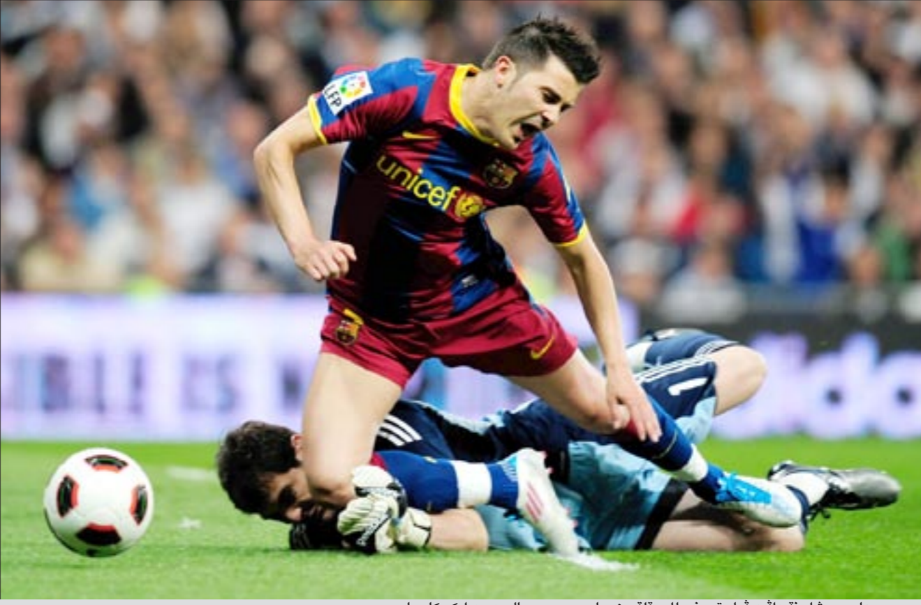
مهاجم برشلونة دافيد فيا يتعرض للعرقله من حارس مرمى ريال مدريد إيكر كاسياس

يشهد ملعب «ميتابيا» في فالنسيا اليوم الفصل الثاني من السلسلة الرباعية لمواجهة برشلونة وريال مدريد، في نهائي كأس ملك إسبانيا لكرة القدم، وكان الفريقان التقيا السبت الماضي في مدريد ضمن المرحلة الـ 32 من الدوري، فانتهى اللقاء بينهما بالتعادل الإيجابي 1 - 1، ليحافظ برشلونة على فارق النقاط الثماني التي تفصله عن غريمه ويقطع شوطا كبيرا نحو الاحتفاظ بلقبه، كما سيلتقي الفريقان مرتين في الأيام المقبلة في ذهاب وإياب نصف نهائي دوري أبطال أوروبا في 27 الجاري و3 مايو المقبل، لتستمتع الملاعب الإسبانية بمواجهة اثنين من أبرز الأندية في العالم أربع مرات في 18 يوما.