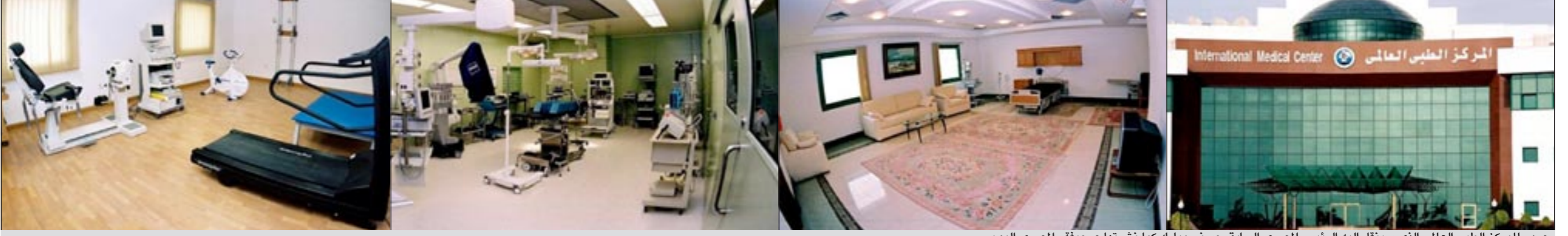
صور للمركز الطبي العالمي الذي سينقل إليه الرئيس المصري السابق حسني مبارك

على مساحة أكثر من 10 أفدنة (42 ألف متر مربع) و-4 مداخل كبرى، ومبنى على هيئة أصابع اليد الخمسة، لم ينفذ منها حتى الآن سوى 3 فقط، هكذا يبدو المركز الطبي العالمي، الذي يقع على طريق مصر - الإسماعيلية الصحراوي، ويتوقع - حسب ما نقله صوره - «المصري اليوم» - أن ينقل إليه الرئيس السابق حسني مبارك خلال ساعات قليلة، ويعتبر مقصدا لمشاهير السياسة والاقتصاد والفن على مستوى مصر والعالم. وعند الكيلو 42 من طريق