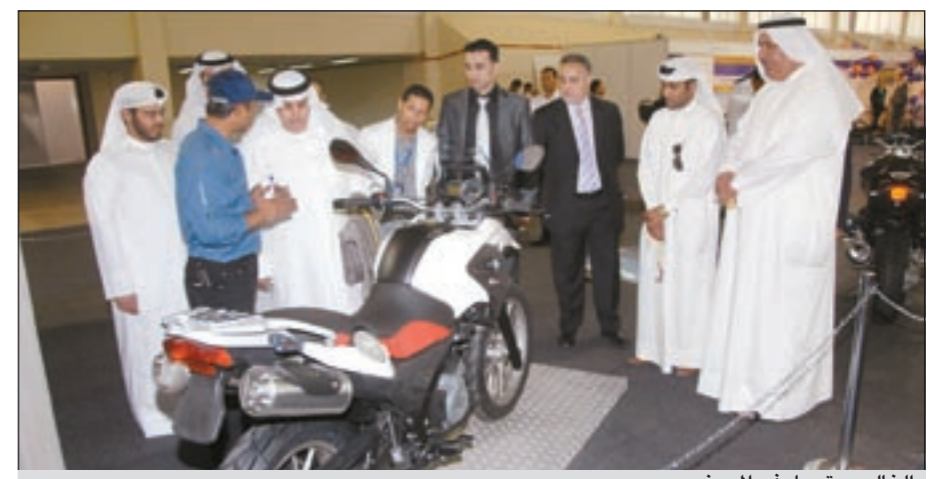
الخالدي يتجول في المعرض

أكد وكيل وزارة التجارة والصناعة عبدالعزيز الخالدي أن الوزارة أصدرت قراراً ينظم المعارض العقارية التي تقام في الكويت ليحكم العلاقة بين المستهلك والشركات العقارية، مشيراً إلى أن «التجارة» حرصت من خلال هذا القرار على ضمان حقوق المستهلكين. وأضاف الخالدي في تصريح صحافي أمس عقب افتتاحه معرض «صنع في ألمانيا بأرض المعارض الدولية» أن من الضروري تصديق أو توثيق الأوراق الخاصة بالعقارات التي تعرض في المعارض التي تقام في الكويت والكائنة في دول أجنبية أو صديقة لاسيما أن الوزارة وردت إليها شكاوى خلال الفترة الأخيرة من قبل بعض المستهلكين تفيد بوجود مشاكل بان السلع العقارية لا يتم تسليمها للمشتريين في الوقت المحدد أو أن هناك مفاصلة في التسليم. وحول رؤيته عن وجود صعوبات في توثيق أو تصديق هذه الأوراق بالنسبة للشركات المنظمة لهذه المعارض قال الخالدي: لا اعتقد أن هناك صعوبات لتصديق الأوراق الخاصة بهذه العقارات في أي دولة وكذلك اعتماد ختم الوزارة من الجهات الخارجية أو السفارات.