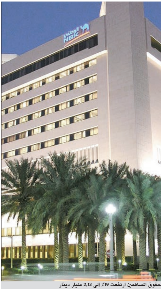
حقوق المساهمين ارتفعت 19% إلى 2,13 مليار دينار

«الوطني» في الربع الأول من العام الحالي عند 20 فلساً للسهم الواحد، وارتفعت موجودات البنك الإجمالية بواقع 9% إلى 13,9 مليار دينار، وارتفعت قيمة حقوق مساهميه بواقع 19% إلى 2,13 مليار دينار، فيما ارتفعت نسبة العائد على الموجودات إلى 2,44% وبلغت نسبة العائد على حقوق المساهمين 15,8% كما في نهاية مارس 2011. كذلك، انخفضت نسبة القروض المتعثرة من إجمالي محفظة القروض من 1,81% إلى 1,69% في الربع الأول من العام الحالي، وبنسبة تغطية بلغت 202,8%. ويحتفظ بنك الكويت الوطني بأعلى التصنيفات الائتمانية على مستوى الشرق الأوسط من وكالات التصنيف العالمية وهي موديز وستاندارد آند بورز فيتش، اعتماداً على أدائه المتنامي وجودة أصوله ومثانة قاعدته الرأسمالية واستراتيجيته الواضحة. كما لدى مجموعة