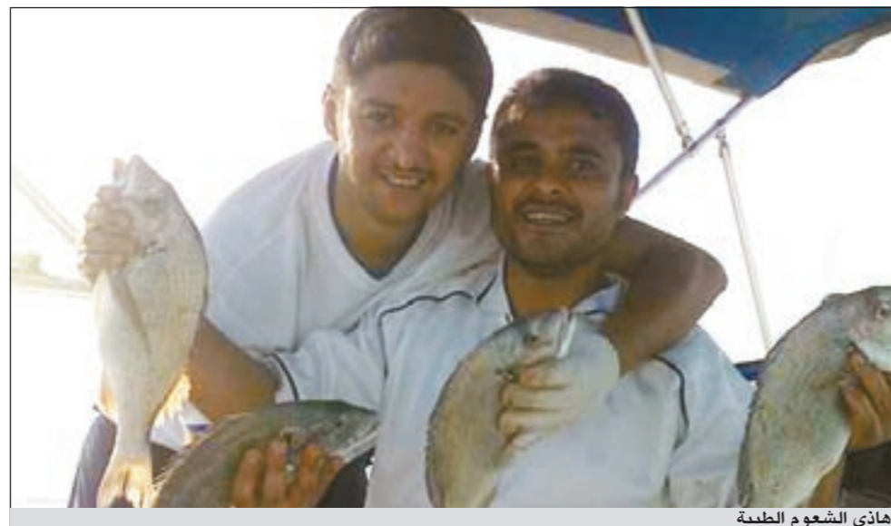
هاذي الشعوم الطيبة

● أحب ان أوجه شكري الخاص الى جريدة «الأنباء» لتخصيصها صفحة أسبوعية تعنى بالبحر والصيد، كما أوجه دعوتي الى كل مرتادي البحر والشاطئ بالمحافظة على بحرنا الغالي، كما أوجه دعوتي الى اخواني الحدائق وأرجو منهم الاهتمام بعدة السلامة والإسعافات الأولية كاملة دون نقصان وفي الختام أدعو للجميع بالصيد الوفير والسلامة.