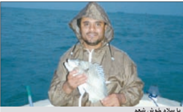
يا سلام خوش شعم