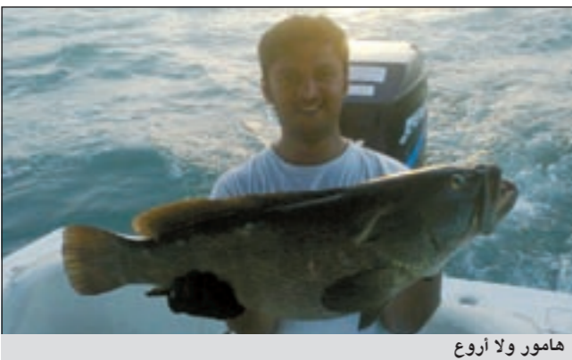
هامور ولا اروع