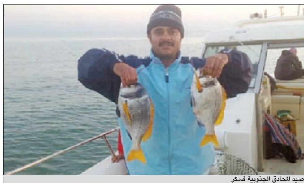
صيد المحادق الجنوبية فسكر