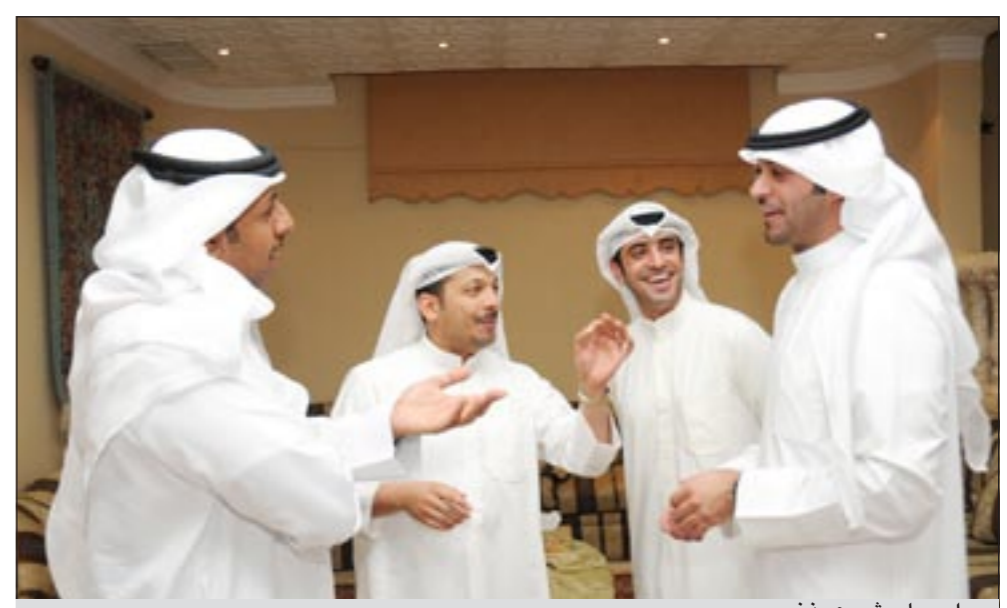
حوار حول مشروع «ذخر»