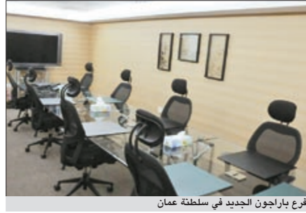
فرع باراجون الجديد في سلطنة عمان