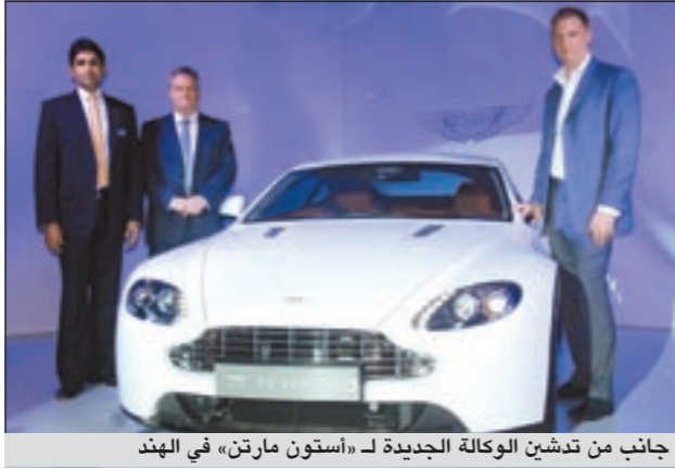
جانب من تشييد الوكالة الجديدة لـ «أستون مارتن» في الهند

وعقب افتتاح وكالة «أستون مارتن» في الهند، يصل عدد الوكالات التابعة للشركة إلى 134 وكلا موزعة في 42 بلدا حول العالم. وفي إطار المخططات التوسعية الطموحة التي تقوم بها «أستون مارتن»، دشنت الشركة وكالات لها في البرازيل وتشيلي وكرواتيا وجمهورية التشيك واليونان وتايوان وتركيا. في الوقت الذي تواصل مساعيها للوصول إلى أسواق جديدة في منطقة الشرق الأوسط والصين.