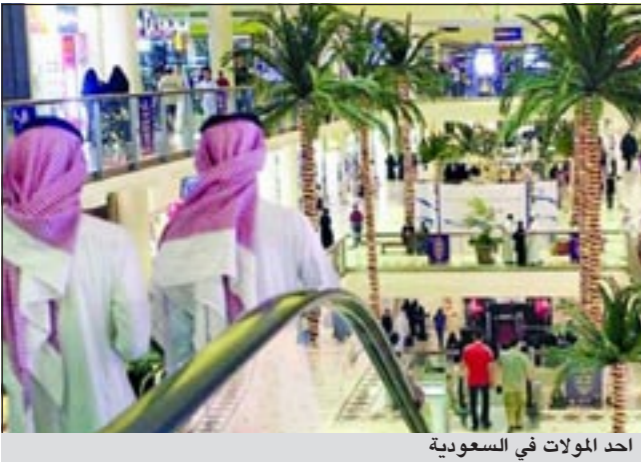
أحد المولات في السعودية

جدة - العربية: ربما لا يعرف الكثيرون أن الشباب الأعزب في السعودية، وعلى غير هدي كل دول العالم، محروم من دخول «المولات» والمجمعات التجارية، إلا برفقة عائلته، أو «أنثى» أربنا الدقة، على أن يلتزم بزي محتشم لا يظهر ساقيه أو ذراعيه، خصوصا في الأوقات التي تعتبرها إدارات المولات «أوقات ذروة» التسوق العائلي، كحفل نهاية الأسبوع أو الأعياد أو الإجازات الرسمية.