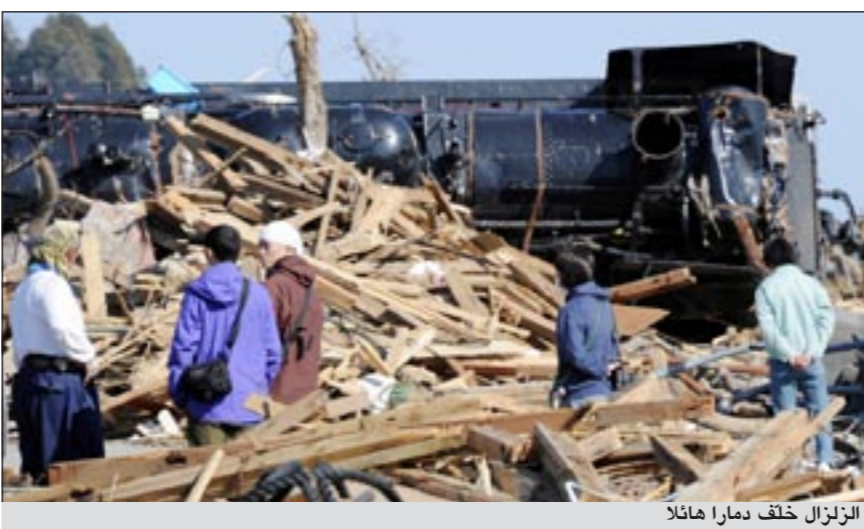
الزلازل خلف دمارا هائلا

طوكيو - يو.بي.أي: طمان رئيس الوزراء الياباني ناوتو كان المجتمع الدولي أمس في رسالة باللغة الإنجليزية بشأن سلامة الأغذية والمنتجات اليابانية.