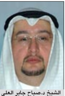
الشيخ د.صباح جابر العلي

نعى مدير عام مؤسسة الموانئ الكويتية الشيخ د.صباح جابر العلي رجل الأعمال ناصر محمد عبدالحسن الخرافي، وقال الشيخ د.صباح جابر العلي ان الكويت فقدت رجلاً من رجالاتها الذين نقشوا سجلاً خالداً في دفتر ذكرايتها ونهضتها وتاريخها.