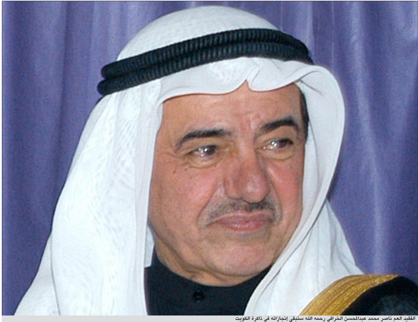
الفقيه العم ناصر محمد عبدالمحسن الخرافي رحمه الله استغفى إنجازاته في ذاكرة الكويت

فقدت الكويت فجر أمس الأحد علما من أبرز شخصياتها الاقتصادية بوفاة رجل الأعمال والاقتصاد ناصر محمد عبدالمحسن الخرافي عن عمر يناهز 67 عاما إثر تعرضه لأزمة قلبية حادة مساء السبت. وكان الخرافي في زيارة للقاهرة بعد قيامه بجولة ضمت إيطاليا ولبنان ثم فضل قبل عودته إلى الكويت زيارة مصر التي أحبها كثيرا. وناصر الخرافي من الشخصيات القليلة في الوطن العربي التي استتاعت ان تحفر اسمها من «ذهب» لتكون رمزا اقتصاديا بفضل حجم الاستثمارات الكبيرة التي تجاوزت الـ 20 مليار دولار في نحو 15 دولة عربية منها مصر ولبنان وسورية والاردن والسعودية والسودان والمغرب وليبيا وغيرها من الدول هذا بخلاف الاستثمارات الضخمة للمجموعة في الكويت.