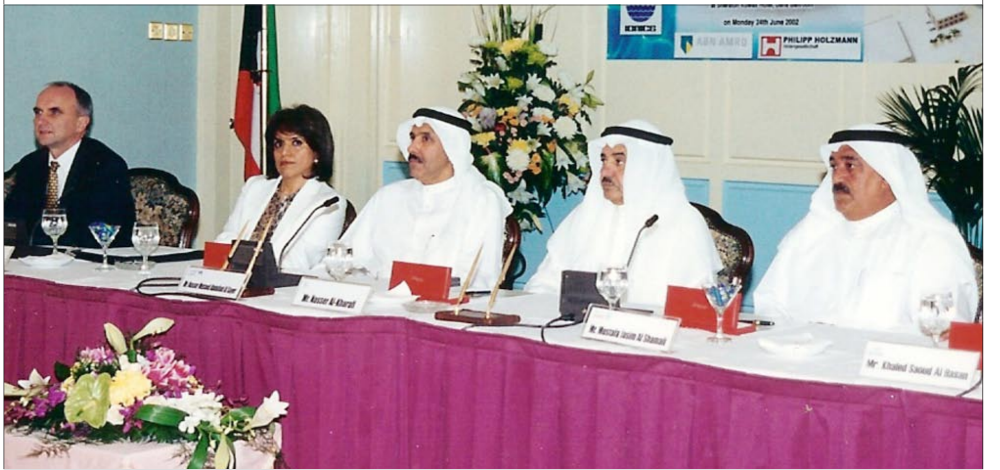
المغفور له بإذن الله ناصر الخرافي خلال توقيع اتفاق تمويل مشروع محطة الصلبة لمعالجة مياه الصرف الصحي

ولعل من أبرز هذه التحديات أزمة الغزو العراقي للكويت التي قاد المرحوم خلالها البنك الوطني لا ليواصل أعماله فحسب، بل أيضاً لأن يلعب دوره الوطني في مساعدة الكويتيين ودعم اقتصاد البلاد. وأشار بيان «الوطني» في نعيه للفقيد الى انه «منذ أن دخل المرحوم ناصر الخرافي مجلس إدارة بنك الكويت الوطني في العام 1993، لم يدخر جهداً في دعم مسيرة البنك وتطوره، مشرعاً أمامه مرحلة جديدة من الازدهار والنمو، تحول خلالها الوطني من بنك محلي إلى لاعب إقليمي وعالمي يقارع البنوك الكبرى في المنطقة. وكان المرحوم قيادياً ومساهمياً رئيسياً في وضع استراتيجية البنك الوطني وخطوط عمله وكافة خططه التوسعية». وختم بيان «الوطني» بالتأكيد على ان الفقيد «ورث عن أبيه الحكمة والتعقل، وقد خلف وراءه أبناء يشاركونه حرصه وغيرته على الكويت وأهلها، ولنا فيهم الأمل والرجاء»، سائلاً الله تعالى ان يتغمده الفقيد بواسع رحمته وان يسكنه فسيح جناته.