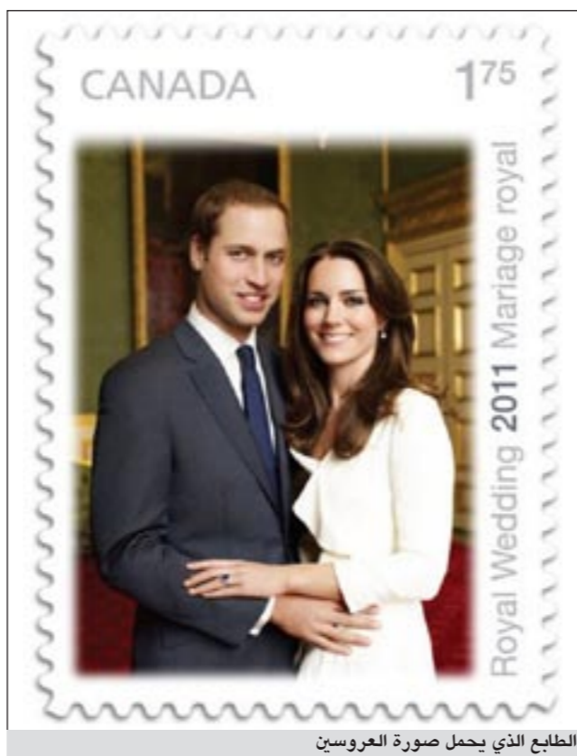
الطابع الذي يحمل صورة العروسين

وتجري على قدم وساق استعدادات هائلة من الشرطة البريطانية استعدادا ليوم 29 أبريل الجاري لتأمين مراسم الزفاف الملكي وتحسبا لأي خروج عن النظام من قبل بعض المنتظرين.