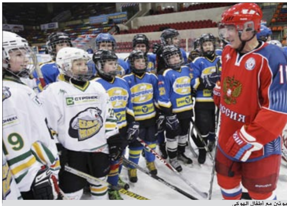
بوتين مع أطفال الهوكي

تكهنت حول نية بوتين في الترشح الى الرئاسة في 2012، وقد تولى بوتين رئاسة روسيا بين عامي 2000 و 2008.