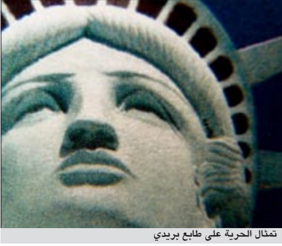
تمثال الحرية على طابع بريدي

نيويورك - أ.ف.ب: حمل طابع بريدي مخصص لتمثال الحرية في نيويورك خطأ صورة نسخة عن التمثال موضوعة في فندق في لاس فيغاس وليس صورة التمثال الشهير. والطابع موضوع في التداول منذ الأول من ديسمبر الماضي، وقد اكتشفت صحيفة «لاس فيغاس ريفيو» الخطأ. فالصورة التي وضعت على الطابع هي نسخة عن التمثال وتزين منذ العام 1997 فندق «نيويورك-نيويورك» في لاس فيغاس.