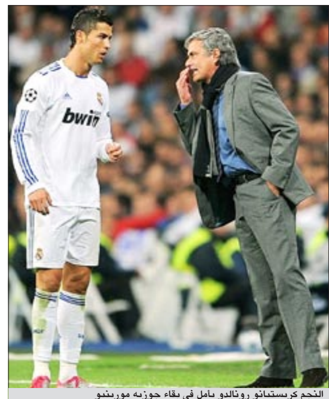
النجم كريستيانو رونالدو يامل في بقاء جوزيه مورينيو

بعدما اكدت عدة تقارير صحافية انجليزية ولاكثر من مرة رغبة البرتغالي جوزيه مورينيو مدرب ريال مدريد الإسباني بالرحيل عن النادي الملكي والانضمام من جديد للدوري الإنجليزي الممتاز، خصوصاً في الآونة الأخيرة حيث كثرت الأقاويل عن رغبته بتدريب نادي مان يونايتد خلفاً للمدرب اليكس فيرغسون، قام نجم النادي الملكي البرتغالي كريستيانو رونالدو بإبداء بتصريح عن الموضوع مطالباً فيه عدم رحيل مورينيو ومتوسلاً لبقائه في النادي. فقد أكد رونالدو ان: مورينيو جزء اساسي من نجاح الفريق، والقابله تتكلم عنه، فقد ربح كل شيء، مضيفاً الى انه سعيد لأن لدى الفريق مدرب كهذا، أملاً ان يحققوا الانتصارات سوياً لنيل الألقاب. وكان مورينيو قد رفض الرد على أسئلة الصحفيين، في المؤتمر الصحافي قبل مواجهة فريقه مع ضيفه برشلونه في الكلاسيكو وترك المهمة لمساعدة ايتور كارانكا. وقال المتحدث باسم الفريق الملكي قبل انطلاق المؤتمر: «لن يجيب جوزيه مورينيو عن أي سؤال»، قبل أن يهجم عدد كبير من الصحافيين بالمغادرة وترك القاعة في مركز ريال التبريدي. ثم شرح كارانكا والي جانبه مورينيو السبب قائلاً «كل مرة يتحدث فيها مورينيو، يتم تضخيم كل شيء. لا يريد تضخيم تصاريحه وتوتير المباراة».