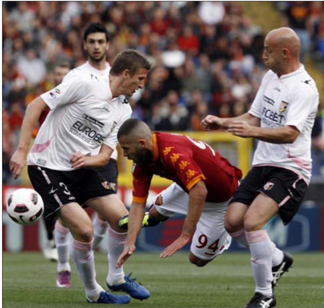
لاعب روما جيرمي ميئين يسقط وسط مجموعة من لاعبي باليرمو