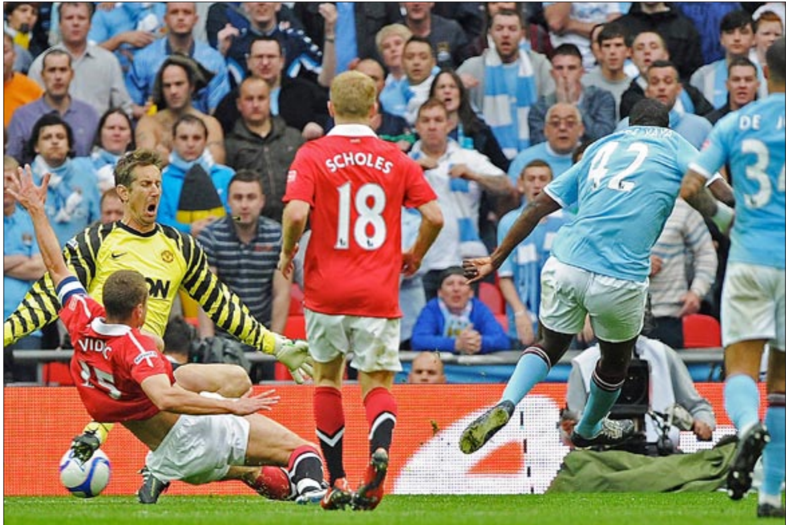
كرة لاعب وسط مانشستر سيتي يحيى توريه في طريقها لهن شباك حارس مان يونايتد فان در سار

مشجعو دورتموند يساندون بايرن أمام ليفركوزن.. وماينتس يعمق جراح مونشنغلاذباخ