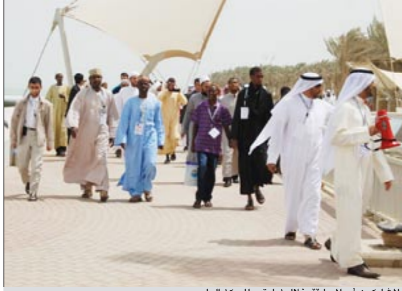
المشاركون في المسابقة خلال زيارتهم للمركز العلمي

وأضاف الصمعي ان التصفيات شملت أيضاً مشاركة الطلبة والطالبات من ذوي الاحتياجات الخاصة التي تم تخصيصها لإشراك أكبر عدد منهم في المسابقة، مشيراً إلى أن شعار مسابقة المرجوم مبارك عبدالعزیز الحساوي بان الله هذا العام هو «القرآن.. أسلوب حياة» لتؤكد أن بالقرآن نسمو ونعتلي كما أن بالقرآن نرتقي وبالقرآن نتعلم ونبني. وأوضح الصمعي أن مرة المتميزين حرص من خلال تنظيمها لهذه المسابقة