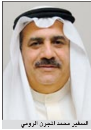
السفير محمد المجرن الرومي

بكين - كونا: اجتمع مدير ادارة آسيا في وزارة الخارجية السفير محمد المجرن الرومي امس مع نائب وزير الخارجية المسؤول عن غرب آسيا وأفريقيا جاي جون. وأوضح بيان صحفي ان الرومي نقل الى المسؤول الصيني تحيات صاحب السمو الأمير وسمو ولي العهد الى القيادة السياسية الصينية وتحيات نائب رئيس الوزراء ووزير الخارجية الشيخ د.محمد الصباح. وأشاد الرومي بالعلاقات بين السيدى وذلك بمناسبة مرور أربعين عاماً على اقامة