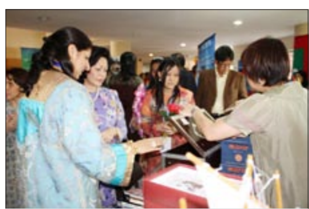
جولة داخل المعرض