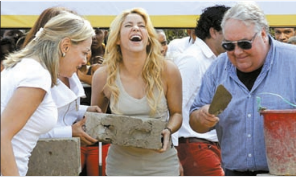
النجمة شاكيرا خلال وضع حجر اساس مدرسة اطفال في تامبتي الاسبوع الماضي

لندن - د.ب.أ: تعزم كيت ميدلتون، عروس الأمير ويليام نجل ولي عهد بريطانيا الأمير تشالز، قضاء الليلة التي تسبق زفافها بأحد الفنادق الفاخرة في