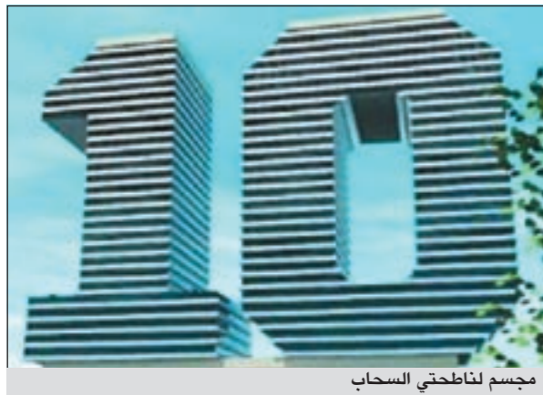
مجسم لناطحتي السحاب

وأكد صاحب المشروع البيروتي، انه كان يفكر في ذلك المشروع منذ زمن طويل، كما انه قدم المشروع الى هيئة انشاء المباني واعطاء التراخيص البنائية في بوينس آيرس منذ عامين، ولم يبق شيء سوى الاقدام على تلك الخطوة وبدا التشييد.