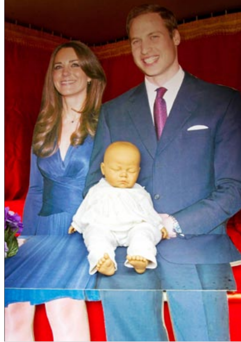
الجسم الكرتوني لوليام وكيت وأمامه دمينة الطفل