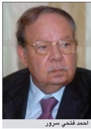
احمد فتحي سرور