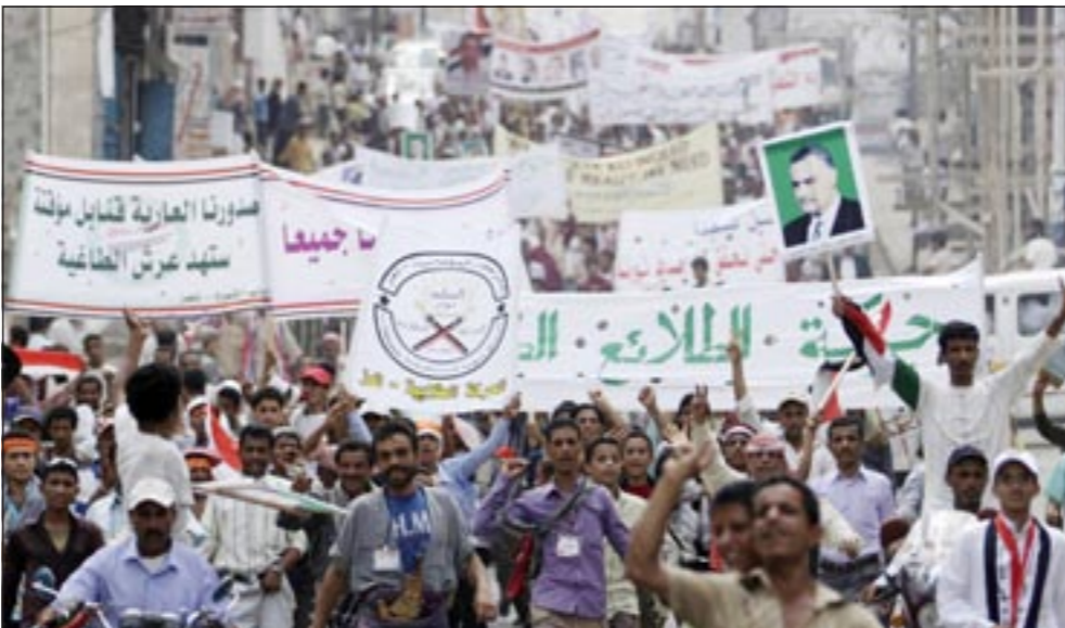
متظاهرون يطالبون برحيل الرئيس اليمني في تعز أمس

مؤخرا وقبل انعقاد الاجتماع الوزاري الاستثنائي لوزراء خارجية دول مجلس التعاون وتضمنت ما اصطلح على تسميتها المبادرة القطرية بندا يقضي - حسب ما أعلنه رئيس الوزراء ووزير الخارجية القطري خلال تواوجه بنيويورك الأسبوع الماضي - تنحي الرئيس صالح عن السلطة اليمينية (دون تحديد إطار زمني)، وهو ما رفضه صالح