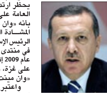
رجب طيب أردوغان

وأكد أن الاجتماعات التي عقدها وفد من وزارة العدل مع وفود قضائية من كندا وسويسرا والولايات المتحدة بهذا الخصوص أصدرت «نتائج مهمة»، موضحا أن السعي متواصل من أجل استرجاع الأموال المهربة إلى الخارج وتنفيذ بطاقات الجلب الدولية ضد المتهمين سواء من خلال الاتفاقيات القضائية الثنائية أو الاتفاقيات الدولية بالنسبة إلى الدول التي تربطها بتونس اتفاقيات ثنائية.