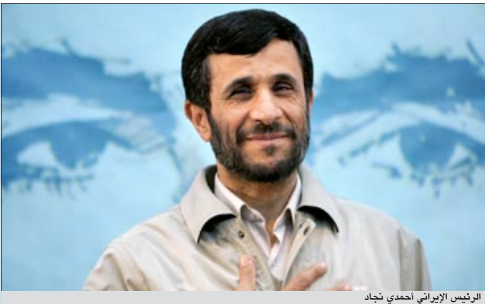
الرئيس الإيراني أحمدني نجاد

وقد تضمنت الصحيفة الرسمية للاتحاد الأوروبي أمس قائمة بأسماء المسؤولين المعندين، ما يعني دخول القرار حيز التنفيذ. حيث يواجه الكثيرون من هؤلاء المسؤولين اتهامات بالتورط في الإجراءات الصارمة التي استهدفت المحتجين على إعادة انتخاب الرئيس الإيراني محمود أحمدني نجاد عام 2009، والتي تردد كثيرا حدوث تلاعب بها.