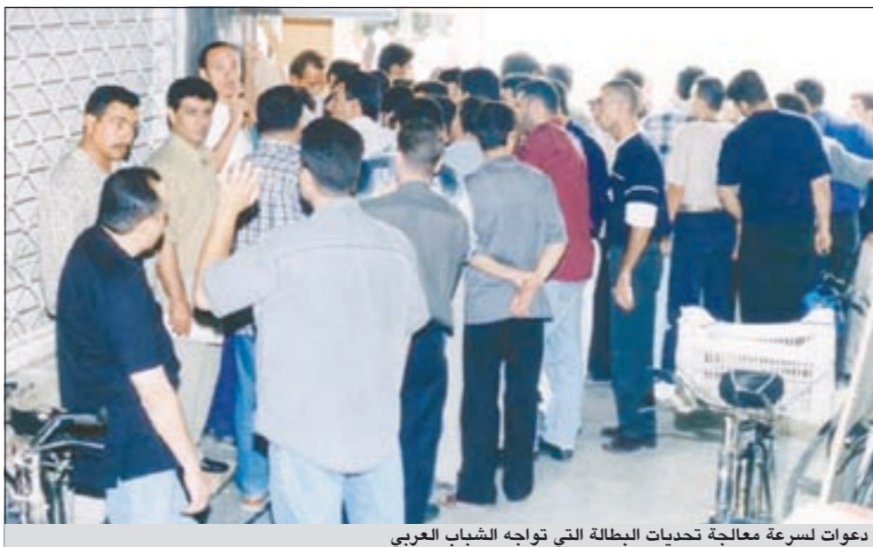
دعوات لسرعة معالجة تحديات البطالة التي تواجه الشباب العربي

تمثل مختلف مستويات الدخل والتنوع الجغرافي والسكاني للمنطقة في كل من السعودية، والجزائر، ومصر، والعراق، والأردن، والمغرب، وعمان، واليمن، والأراضي الفلسطينية.