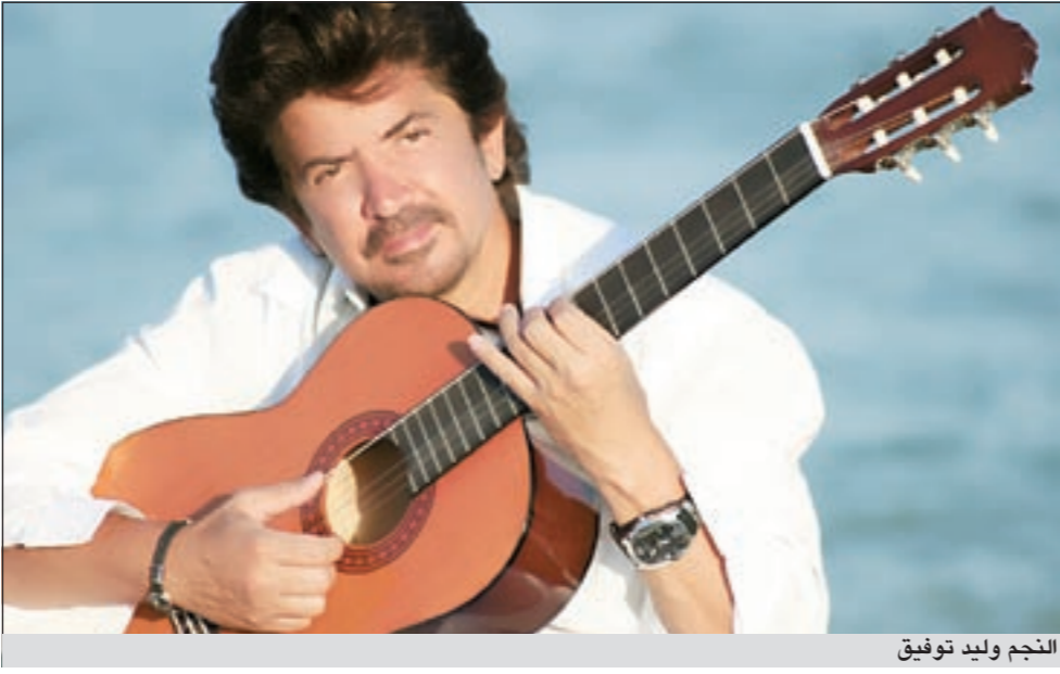
النجم وليد توفيق

«الشحرورة» صباح وهي ما زالت على قيد الحياة ويتصدي كارول سماعة للبطولة، لاسيما أنها مطربة وممثلة في آن ما يجعلها الأقرب إلى شخصية صباح، مؤكداً أن المسلسل سيكون واقعياً لا بعد الحدود، متمنياً لفريق العمل النجاح.