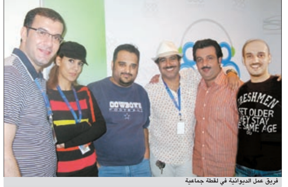
فريق عمل الديوانية في لحظة جماعية