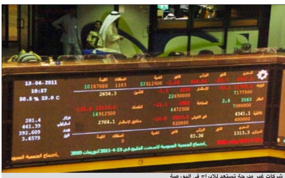
شركات غير مدرجة تستعد للإدراج في البورصة

وفيما يتعلق بالجمعيات العمومية، فإن تشدد وزارة التجارة على مخالفة الشركات المساهمة التي لم تسلم ميزانيتها لأعوام سابقة وعدم انعقاد الجمعيات العمومية وتحولها إلى النيابة العامة أدى إلى توجه أكثر من شركة إلى عقد جمعيات عمومية لسنوات سابقة لم تعقد ومنها (بيان القابضة، والكويتية الدولية للاستثمار). فقد انعقدت العديد من الجمعيات العمومية لشركات