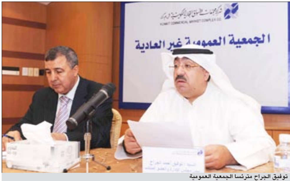
توقيع الجراح مترنسا الجمعية العمومية

كذلك زيادة رأسمال الشركة عن طريق خيار الأسهم للموظفين الكفاء بعدد 10 ملايين سهم بقيمة اسمية قدرها 100 فلس للسهم الواحد وعلاوة اصدار قدرها 125 فلسا تسدد على دفعات سنوية، وتخفيض رأسمال الشركة بمبلغ مليون دينار قيمة أسهم الموظفين التي لم يتم الاكتتاب بها.