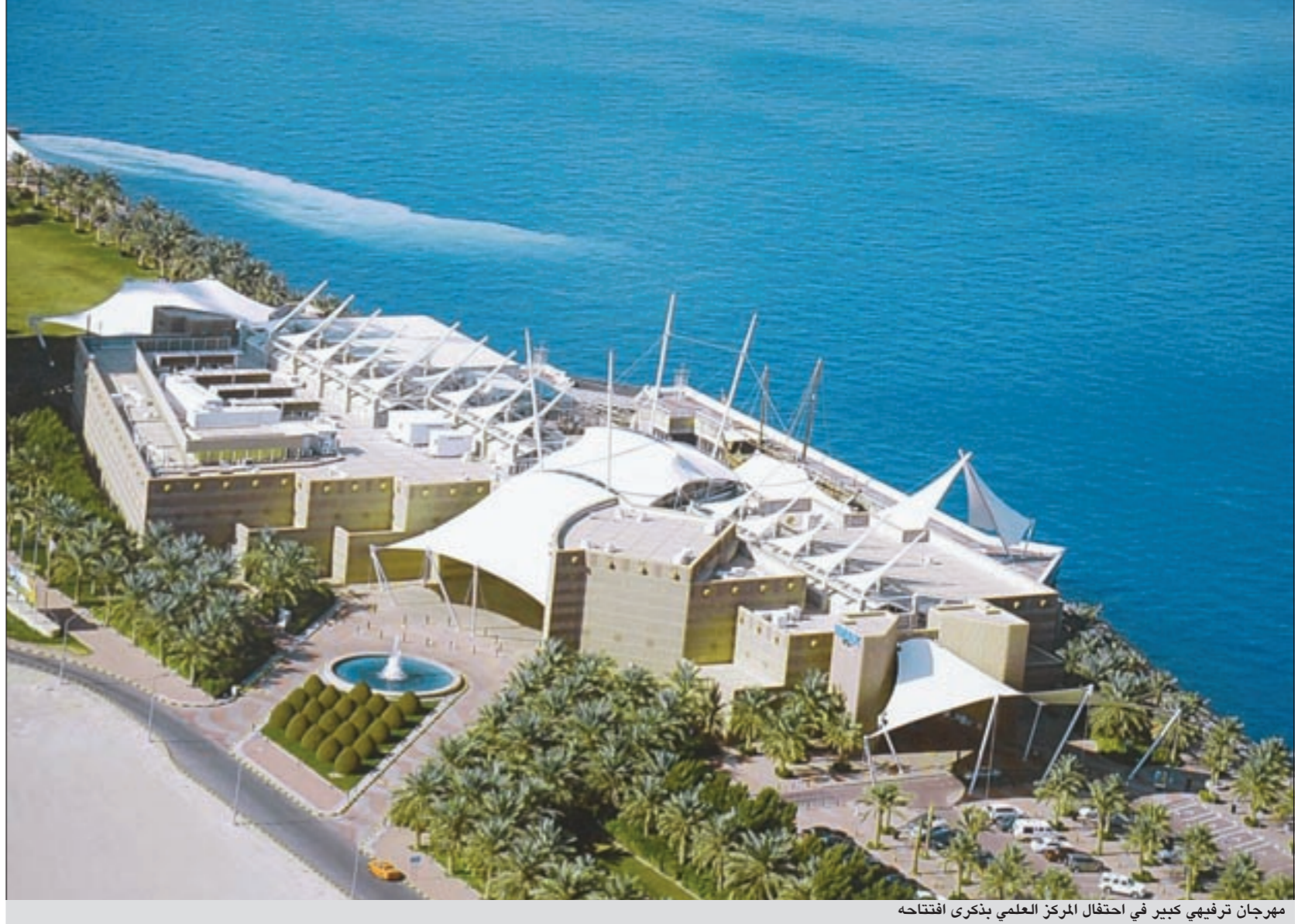
مهرجان ترفيهي كبير في احتفال المركز العلمي بذكرى افتتاحه

وبينت ان لجنة التحكيم تضم خبراء من دول عدة مثل كندا وروسيا والمانيا