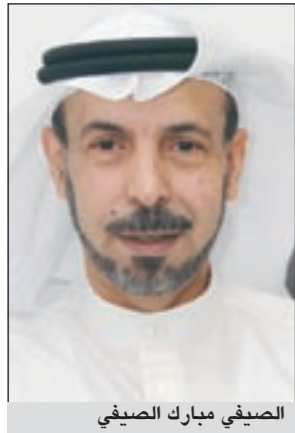
الصفوي مبارك الصفي