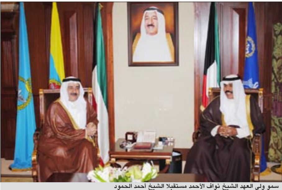
سمو ولي العهد الشيخ نواف الأحمد مستقبلاً الشيخ أحمد الحمود

استقبل سمو ولي العهد الشيخ نواف الأحمد في ديوانه بقصر بيان صباح امس سمو رئيس مجلس الوزراء الشيخ ناصر المحمد. كما استقبل سمو ولي العهد الشيخ نواف الأحمد في ديوانه بقصر بيان صباح امس نائب رئيس مجلس الوزراء ووزير الداخلية الشيخ أحمد الحمود.