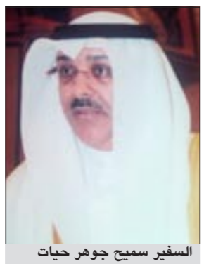
السفير سميح جواهر حيات