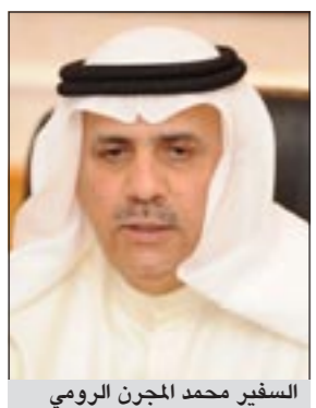
السفير محمد المجرن الرومي

كوالالمبور-كونا: بحث مدير ادارة آسيا بوزارة الخارجية السفير محمد المجرن الرومي مع نائب وزير دائرة العلاقات الخارجية للجنة المركزية للحزب الشيوعي الصيني لي جينجونج في مكتبه بالعاصمة بكين سبل تطوير العلاقات بين البلدين ودفع العلاقات الثنائية الى الامام في جميع المجالات. وذكر بيان صادر عن سفارتنا في بكين امس انه تم التباحث أيضاً في التطورات الأخيرة في منطقة الخليج العربي وبعض الدول العربية. من جهته اعرب جينجونج عن تقديره لصاحب السمو الأمير الشيخ صباح الأحمد ودوره الكبير في تطوير العلاقات الثنائية داعياً الى احترام قرار مجلس الامن الدولي المتعلق بالحالة بين الكويت والعراق وتطبيق ما جاء في القرار. واكد ان بلاده تؤيد الاجراءات