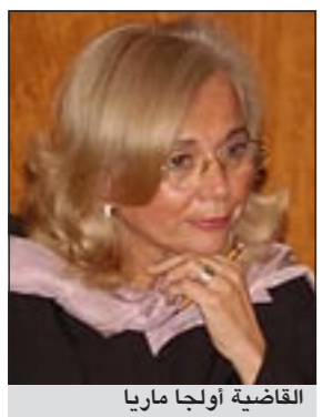
القاضية أولجا ماريا

مكسيكو - كونا: اجتمع سفيرنا لدى الولايات المتحدة المكسيكية سميح جواهر حيات مع عضو المحكمة العليا في المكسيك ورئيسة المنتدى الدولي للمرأة - فرع المكسيك - القاضية أولجا ماريا سانشير كورديرو. وذكرت سفارتنا لدى الولايات المتحدة المكسيكية في بيان لها امس ان السفير حيات بحث مع القاضية أولجا خلال اللقاء سبل تعزيز العلاقات الثنائية بين الكويت والمكسيك في المجالات القضائية والقانونية الفيدرالية وكذلك سبل دعم الجهود الدولية لتنمية المرأة. وقال البيان ان السفير حيات أكد خلال اللقاء ضرورة تبادل الزيارات والخبرات والأفكار بما يسهم في تعميق وتطوير اواصر العلاقات في المجال القضائي والقانوني بين البلدين وكذلك العمل على تعزيز التنسيق والتعاون في هذا المجال على المستوى