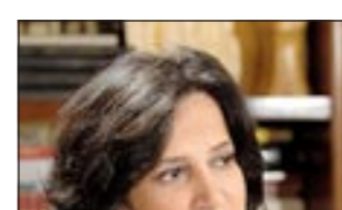
الشيخة مي آل خليفة

أعلنت هيئة الملتقى الاعلامي العربي عن اختيارها للشيخة مي بنت محمد آل خليفة وزيرة الثقافة في مملكة البحرين لجائزة الابداع الاعلامي لهذا العام عن «التطويع الثقافي للإعلام» والتي سيتم تكريمها خلال فعاليات الدورة الثامنة من أعمال الملتقى الاعلامي العربي التي تحتضنها الكويت في الفترة من 24 إلى 26 الجاري تحت رعاية سمو الشيخ ناصر المحمد رئيس مجلس الوزراء. وكانت هيئة الملتقى الاعلامي العربي خلال السنوات الأخيرة تولي اهتماماً كبيراً بقضية الثقافة في العالم العربي وارتباطها بالاعلام ودوره وكانت تتابع عن قرب كل الجهود المبذولة في هذا الاطار وقد سبق وان كرمت الهيئة عدداً من رموز الثقافة والمشتغلين فيها في دورات سابقة.