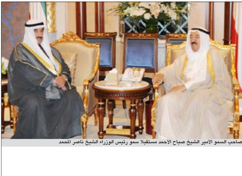
صاحب السمو الأمير الشيخ صباح الأحمد مستقبلاً سمو رئيس الوزراء الشيخ ناصر المحمد

استقبل سمو ولي العهد الشيخ نواف الأحمد في ديوانه بقصر بيان صباح امس سمو رئيس مجلس الوزراء الشيخ ناصر المحمد. كما استقبل سمو ولي العهد الشيخ نواف الأحمد في ديوانه بقصر بيان صباح امس نائب رئيس مجلس الوزراء ووزير الداخلية الشيخ أحمد الحمود.